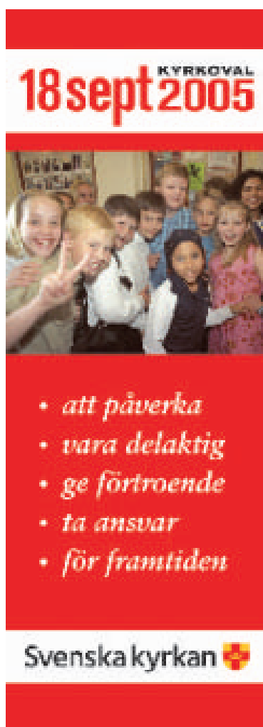
Tröjor och roll-ups/vepor kan också beställas från Informationservice. Läs mer på kyrkovaletswebben.