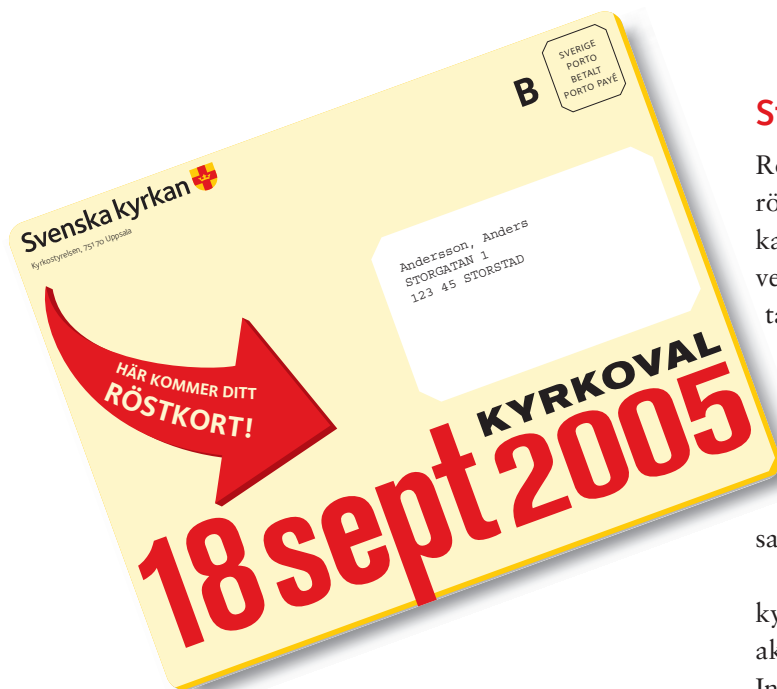
Framsidan på röstkortsutskicket. Själva röstkortet finns inuti denna folder med information om Svenska kyrkan och valet.