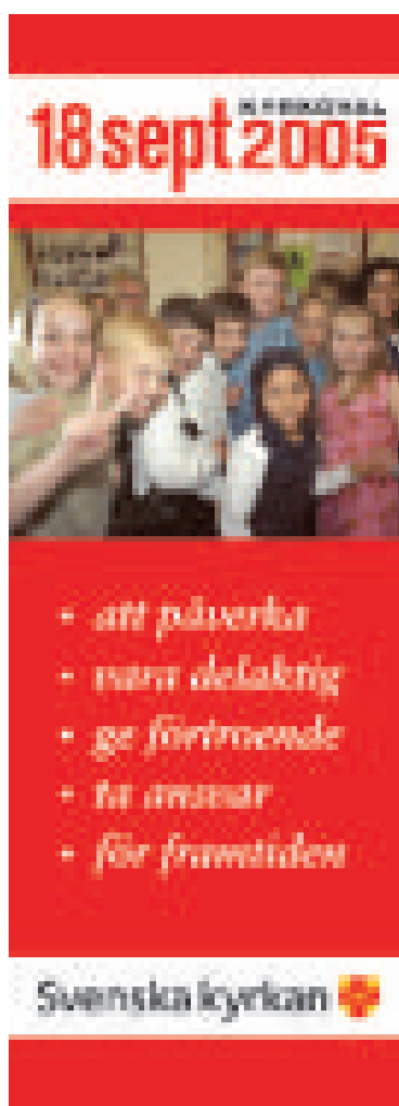
Tröjor och roll-ups/vepor kan också beställas från Informationservice. Läs mer på kyrkovalswebben.