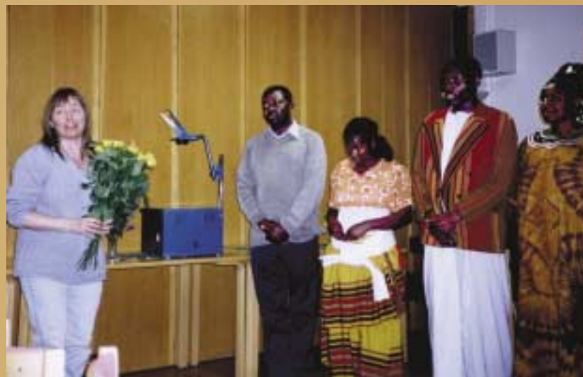
Besök från Uganda på en av de tjugotalet studiecirkelträffar som Arvika pastorat arrangerat om miljö- och rättvisefrågor.

Nu vill vi dela med oss av våra kunskaper och erfarenheter till andra församlingar i stiftet. Hur kan den lokala församlingens verksamhet bli mer miljö- och rättvisanpassad? Vilka möjligheter finns för att samarbeta med kommunen eller lokala byalag och andra organisationer?