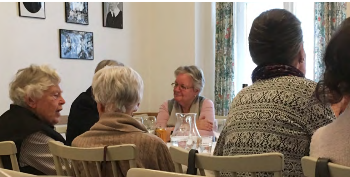
Seniorgruppen träffas första onsdagen i månaden.