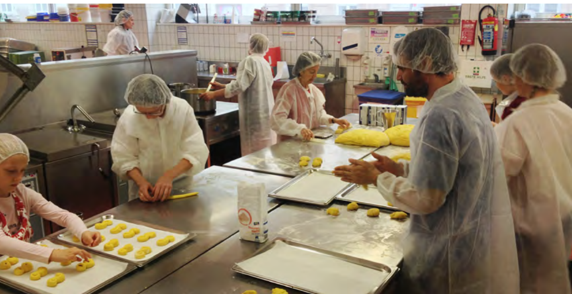
Febril verksamhet när mer än 2500 Lussekatter bakas!