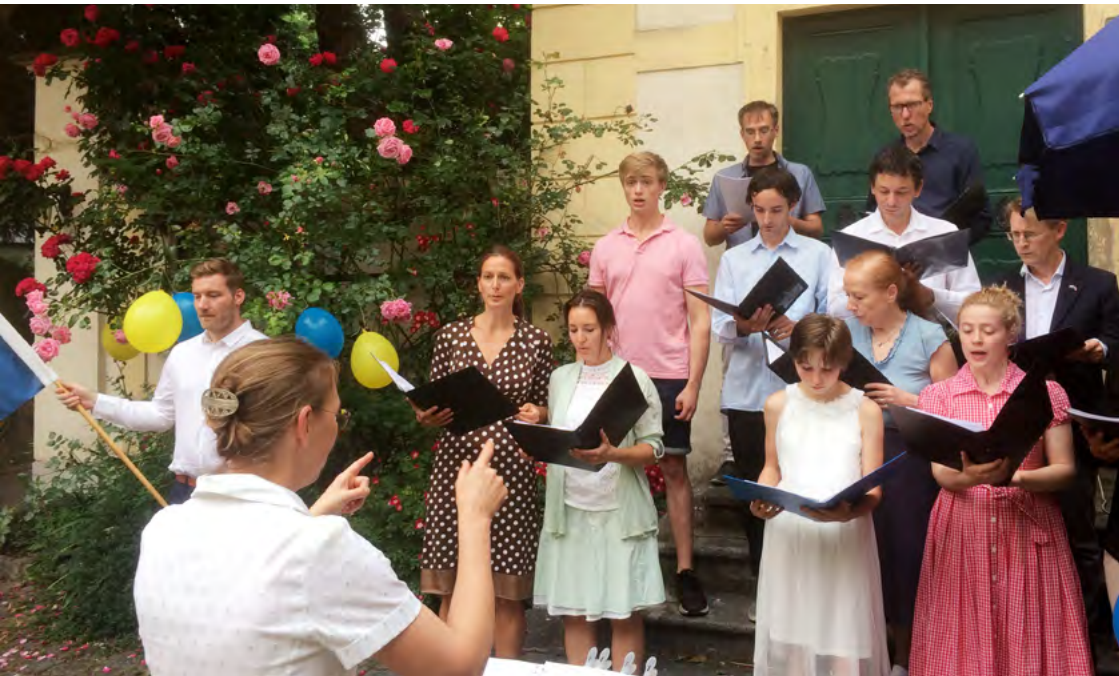
Svenska kyrkan i Wiens kör sjunger på nationaldagen