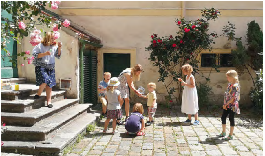
Barnen leker på innergården efter mässan