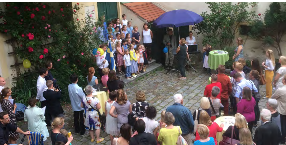
Härlig vårstämning under Valborgsmässofirandet överst och nationaldagsfirande på fotot ovan