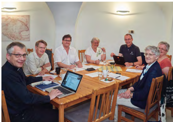
Kyrkorådet sammanträder en gång i månaden.

Vi som kyrkoråd arbetar för en levande kyrka, dit du som kyrkobesökare ska känna dig välkommen. Om du har några frågor eller synpunkter på kyrkans verksamhet, tag gärna kontakt med oss! Kontaktuppgifter finns på sista sidan i Wienbladet.