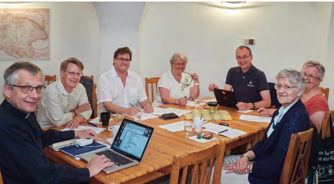
Kyrkorådet sammanträder en gång i månaden

Vi som kyrkoråd arbetar för en levande kyrka, dit du som kyrkobesökare ska känna dig välkommen. Om du har några frågor eller synpunkter på kyrkans verksamhet, tag gärna kontakt med oss! Kontaktuppgifter finns på sista sidan i Wienbladet.