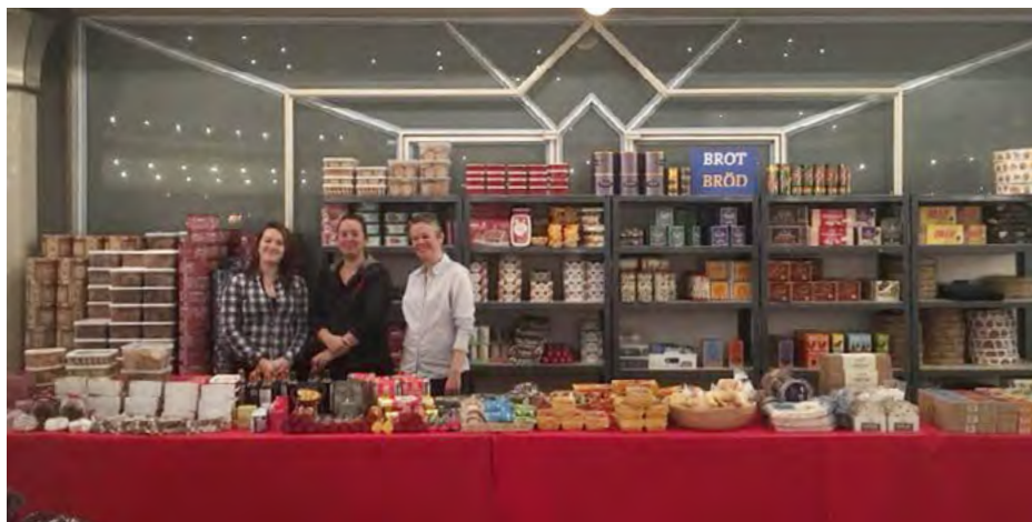
Brödbordet är färdigt! Efter julbasaren är bara en bråkdel av matvarorna kvar.

Tack alla som hjälper till med vår basar!