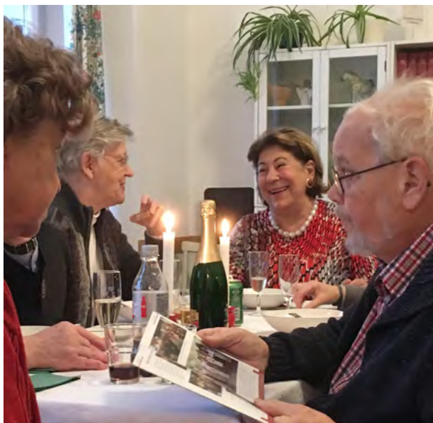
Seniorgruppen träffas första onsdagen i månaden