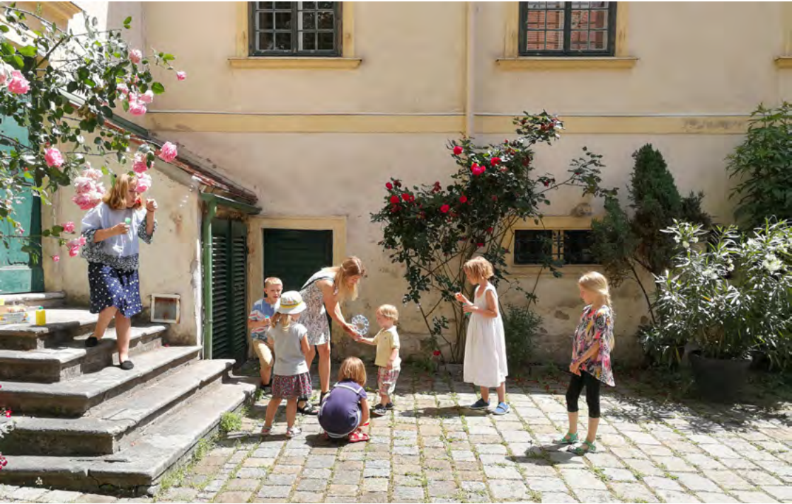
Barnen leker på innergården efter mässan