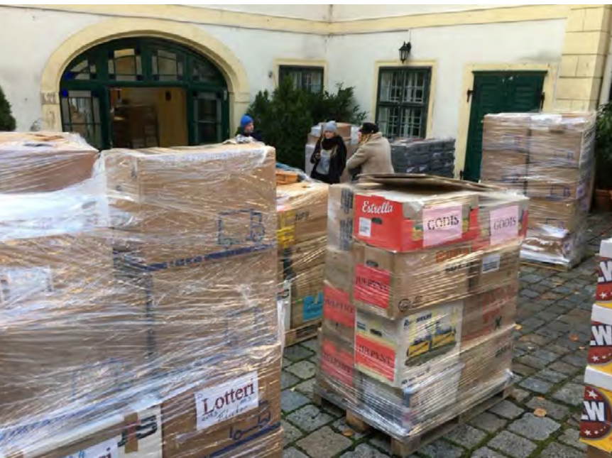
T.v. Varorna är packade och klara. Nu ska de köras till basarlokalen.

Alla de olika varustånden på julbasaren har en ansvarig.