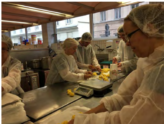
Flitiga lussekattbagare i full utrustning för att uppfylla alla hygienbestämmelser !

Bakdagen den 21 oktober lockade 14 entusiastiska lussekattbagare. Det mättes, knådades och formades. Hela 1800 Lussekatter bakades inom ett par timmar. Kom och njut av dessa goda bakverk på årets julbasar!