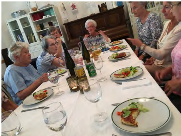
Seniorgruppen träffas första onsdagen i månaden.