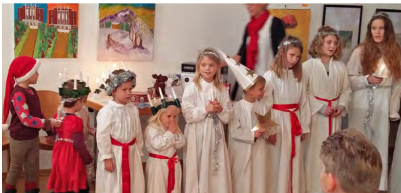
Luciafirande i Salzburg 2016

Tisd 19 dec, kl 16:30, Adventgudstjänst Prag