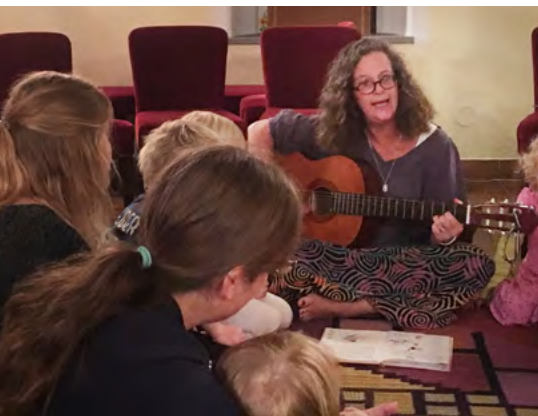
Mia sjunger med barnen