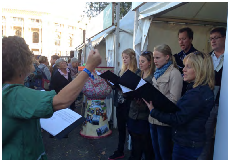
Svenska kyrkans kör lockade många åskådare