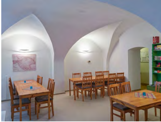
Caféet har fått nytt golv, ny belysning och väggarna har målats om