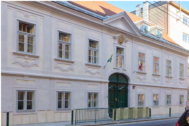
Ny fasad på Gentzgasse 10

Svenska kyrkans lokaler har även fått en ny fasad. I tre månader har hantverkare jobbat med att putsa, skrapa och måla ytterväggen mot Gentzgasse, som nu lyser med ny glans.