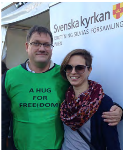
Många passade på att få en kram för frihet