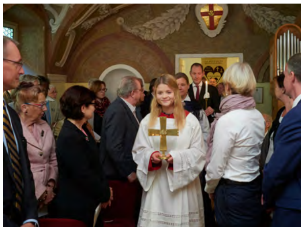
Bild t.h. Procession från kapellet