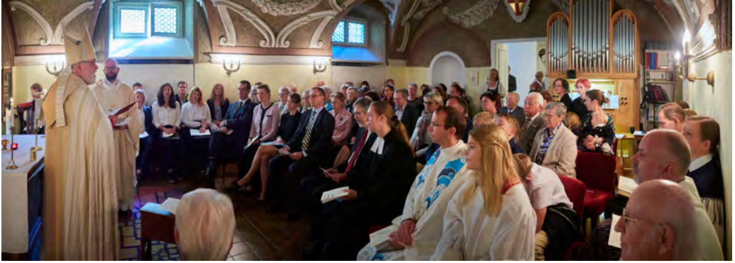
Kyrkan var full av församlingsmedlemmar och inbjudna gäster