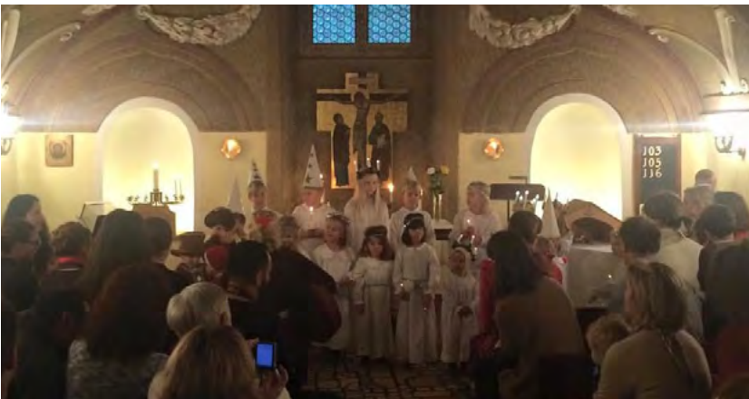
Barnens Luciagudstjänst i Wien