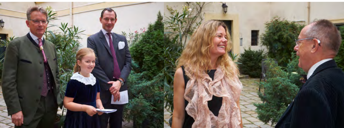
många stiligga gäster,