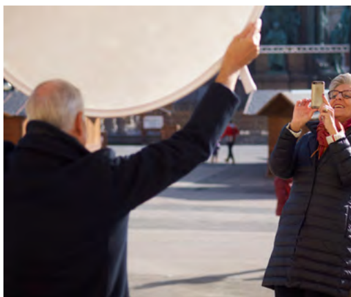
Samarbete är viktigt när fotot till titelsidan ska tas!