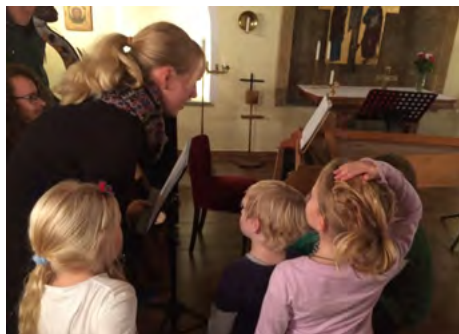
Vad är det för instrument?

Måndag den 24 oktober intogs kyrksalen av ett gäng barockmusiker med sina instrument. På eftermiddagen gjorde de en presentation och minikonsert för småbarnsgruppen, och senare på kvällen var det dags för konsert. Vi hoppas få se och höra Ensemble ALMIRA snart igen här i kyrkan!