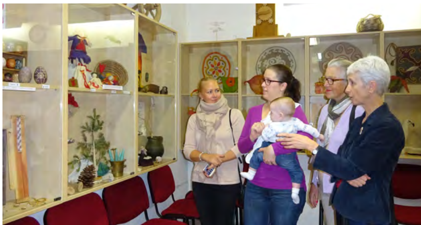
Besök på en hemslöjdsutställning i Budapest