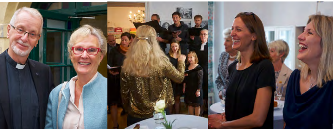
körsång och glada skratt!