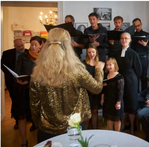
Kyrkokören sjunger vid 30-årsjubileet.

Kören medverkar regelbundet i kyrkans gudstjänster samt vid traditionella högtider så som Lucia, Valborg, nationaldagsfirande samt midsommarfirande.