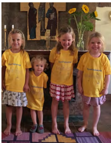
TonFiskarna i nya tröjor

Barnkören medverkar vid familjegudstjänster i kyrkan. Ibland sjunger vi tillsammans med barnen från Svenska skolan, t ex vid Luciatåget på julbasaren samt Valborgsfirandet på kyrkans innergård. De olika framträdandena är alla delar av verksamheten och nyttig övning för var och en att stå framför en publik.