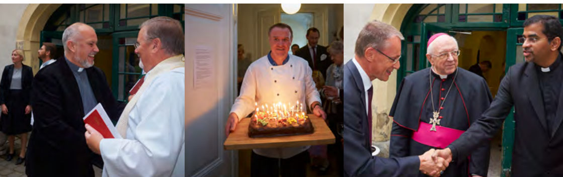
Allt som hör ett jubiléum till: Tårta,