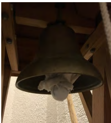
Kyrkklockan var dymlad