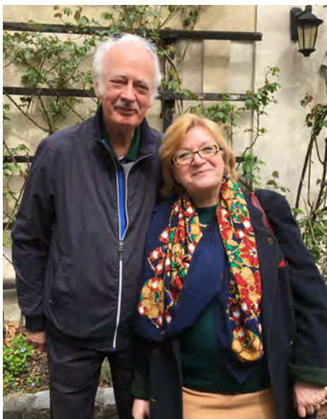
Familjen Bratt var på gudstjänsten