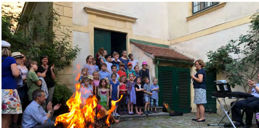
Barnkören från Svenska skolan sjöng vackra vårvisor