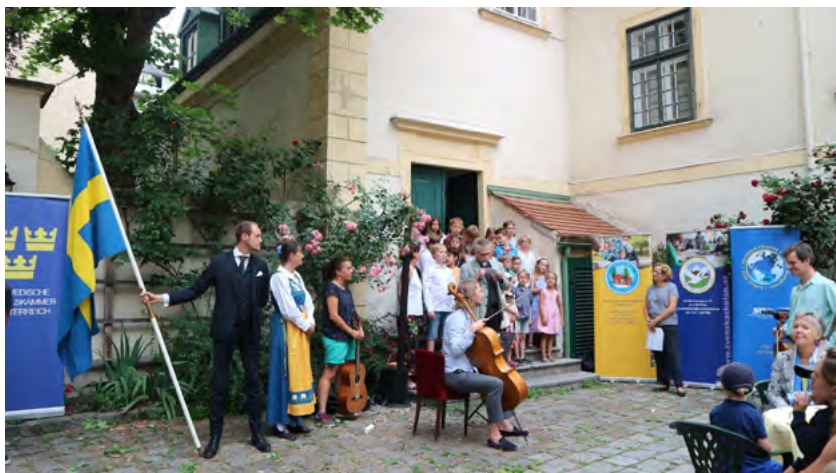
Svenska skolans kör sjöng vackra sånger

Nationaldagen firades i samarbete med SWEA och Svenska ambassaden.