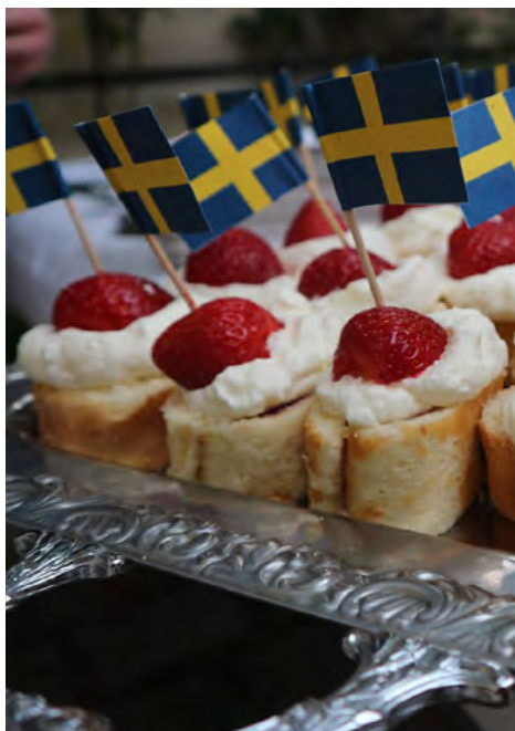
Både flaggan och sverigebakelserna var på plats