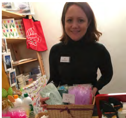
Som vanligt fanns det mycket att fynda