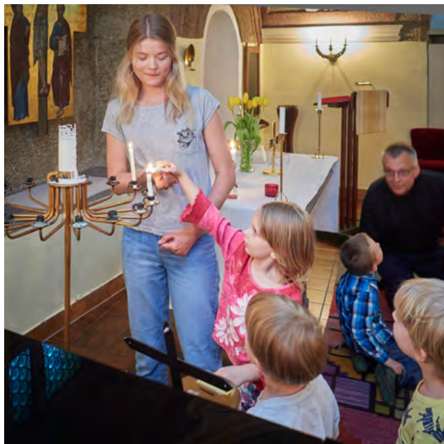
Ljuständning med barngruppen

TonPrickarna kl. 16:30-17:30 (ej 2/11). Avslutning i samband med Barnens luciatåg den 9 december kl. 11:00.