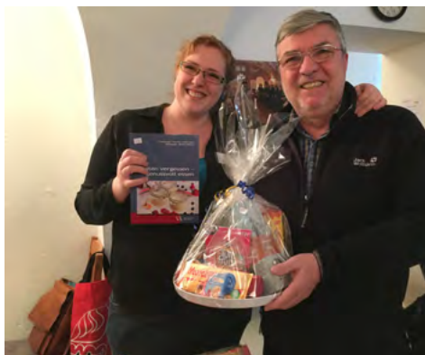
Glada vinnare i lotteriet!