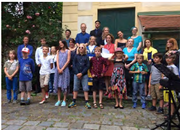
Nationaldagskörens glada sångare

Mycket händer och sker i vår fina församling. Som vanligt har vi även detta år hälsat våren välkommen med Valborgsfirandet och samlats till traditionsenligt Nationaldagsfirande den 6 Juni samt dansat runt midsommarstången. Många personer samlades på kyrkans fina innergård, sjöng, åt svenska godsaker och hade trevligt tillsammans.