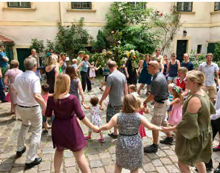
Dans kring midsommarstången