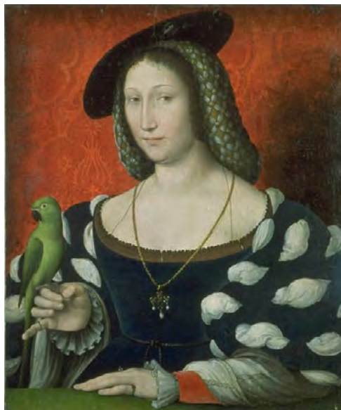
Marguerite de Navarre

Två av de många kvinnor som tog aktiv del i reformationen var Marie Dentière (1495-1561) och Marguerite de Navarre (1492-1549). Dentière var en schweizisk reformator och teolog, i hennes verksamhet som författare och predikant jobbade hon hårt för reformationen i Genève. Hon kallades för de protestantiska kvinnornas språkrör av var en avgörande del i arbetet för att stänga klosterväsendet. Hon jobbade nära John Calvin och skrev åt honom i perioder. Hon är också den enda kvinnan som räknas till de protestantiska reformatörerna. De Navarre är dotter till den franska kungen Francis I och under sin uppväxt fick hon samma utbildning som sin bror, den kommande kungen, och var en av dåtidens högst