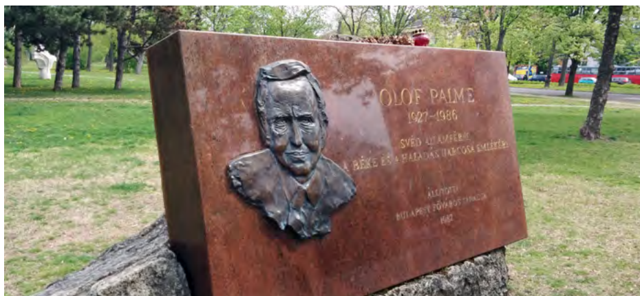
Minnesmärke över Olof Palme i Budapest