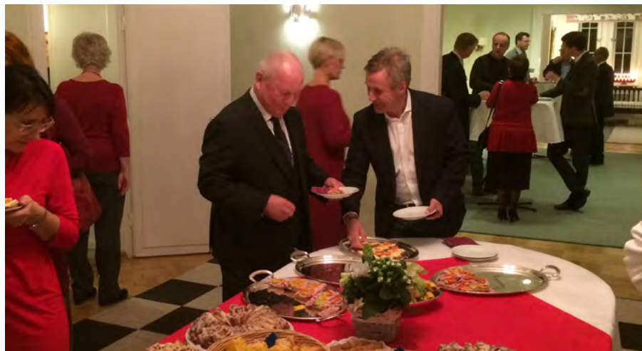
Sveriges ambassad i Tjeckien bjöd på rikt kyrkkaffe.