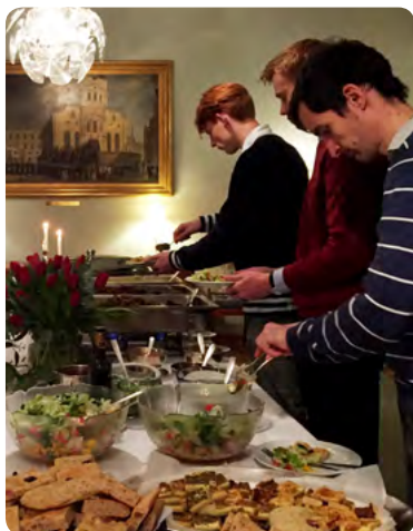
God mat serverades.

Schwedenhaus på Liechtensteinstrasse i 9:e distriktet. Betydligt mer plats och en fantastisk omgivning bjöds på årets tackfest i ambassadens festlokaler!