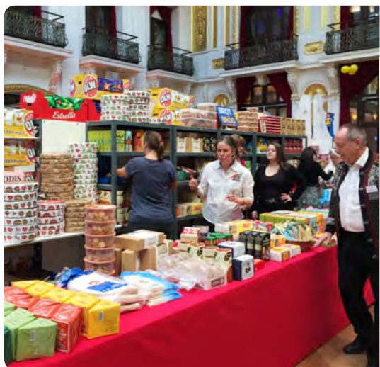
Förberedelserna för brödförsäljningen är i full gång! Det säljs stora mängder knäckebröd och pepparkakor på vår julmarknad. Vid 17-tiden brukar det endast finnas enstaka produkter kvar!