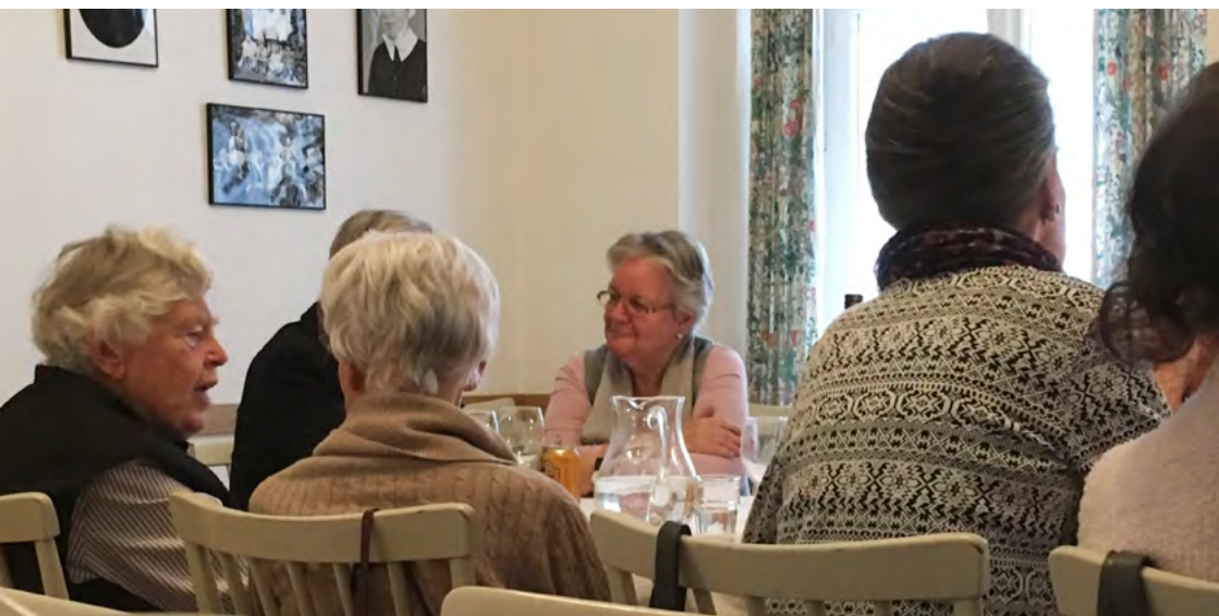
Seniorgruppen träffas första onsdagen i månaden.