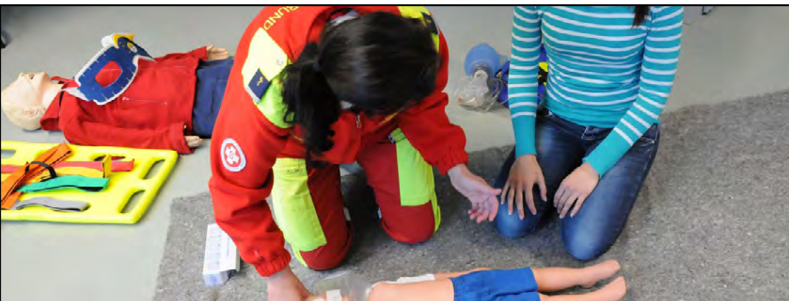
Instruktören från Samariterbund visar hur man ger första hjälpen.