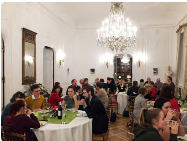
Tackfesten på ambassaden var välbesökt.