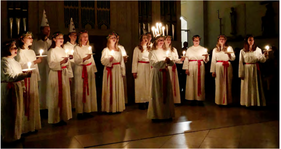
Julkonserten med Lucia i Pfarre St. Gertrud