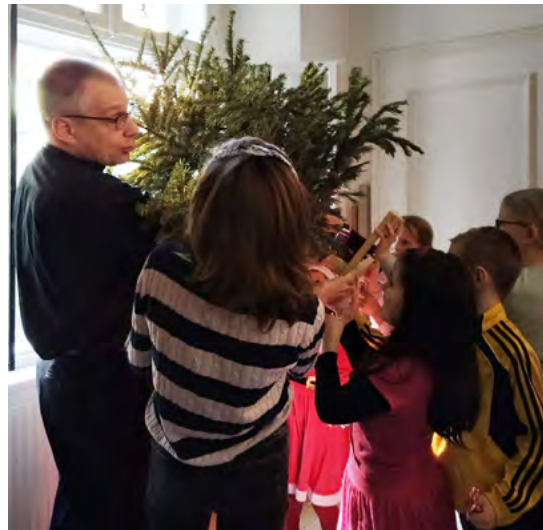
Kyrkans julgran slängs ut genom fönstret!

Barnen fick sedan hjälpa till att klä av granen alla kulor, glitter och godis. Granen slängdes sedan ut genom fönstret!