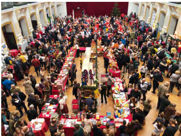
Den nya lokalen Sofiensäle lockade många besökare.

Julmarknaden blev en stor framgång. Det kom rekordmånga besökare och omsättningen blev också rekordstor. Ett sådant här evenemang hade aldrig varit möjligt utan alla engagerade frivilliga!