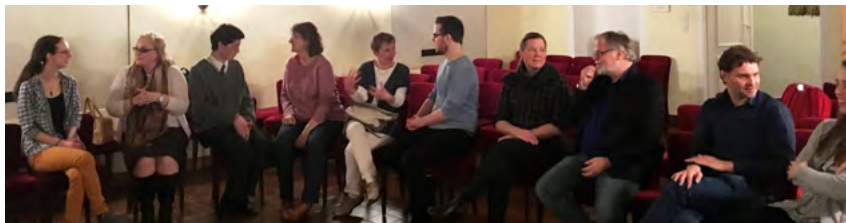
Alla-kan-sjunga-körens första övningsstillfälle!

Varmt välkomna att fira Valborg med oss på kyrkans innergård. Medverkan av Valborgskören, TonPrickarna samt elever från Svenska skolan. Vårtal, fiskdamm samt försäljning av mat och dryck.