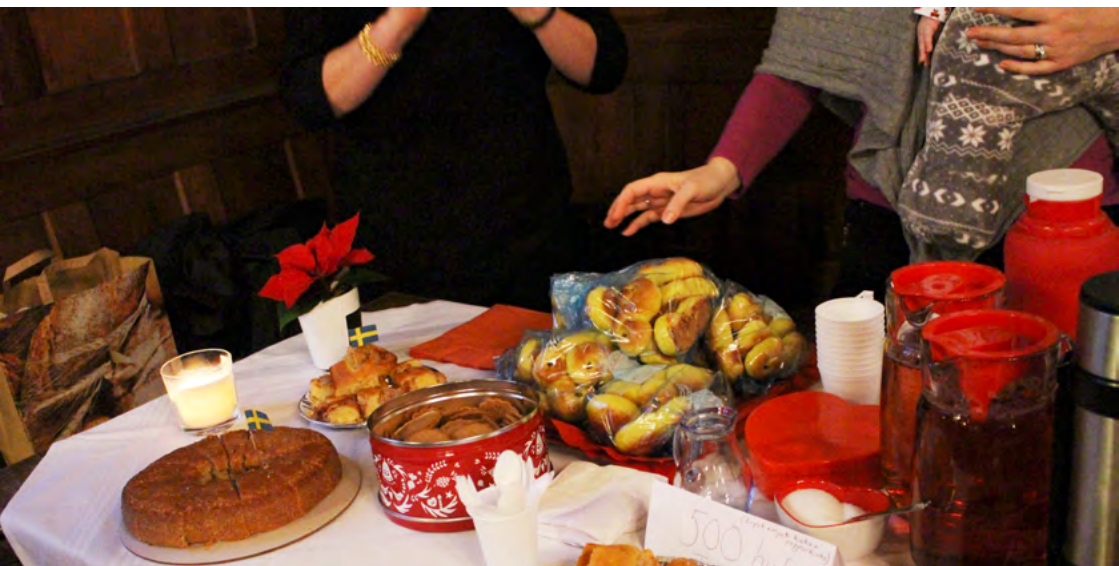
Det bjöds på bullar, pepparkakor och andra goda kakor efter adventsgudstjänsten i Budapest.

Som traditionen bjuder, hölls den andra advent en gudstjänst i Budapest, då alla svenskar och svensksintreserade var inbjudna till Kelenföldi Evangélikus templom på Budasidan. Adventsgudstjänsten är ett samarrangemang av Sveriges ambassad i Budapest, SWEA Budapest och Ungersk-Svenska Föreningen.