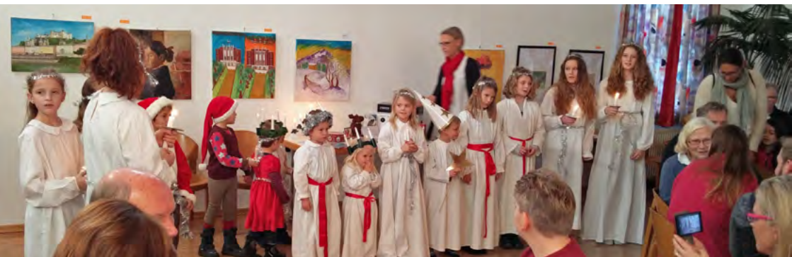
Många barn deltog i barnens luciatåg i Salzburg