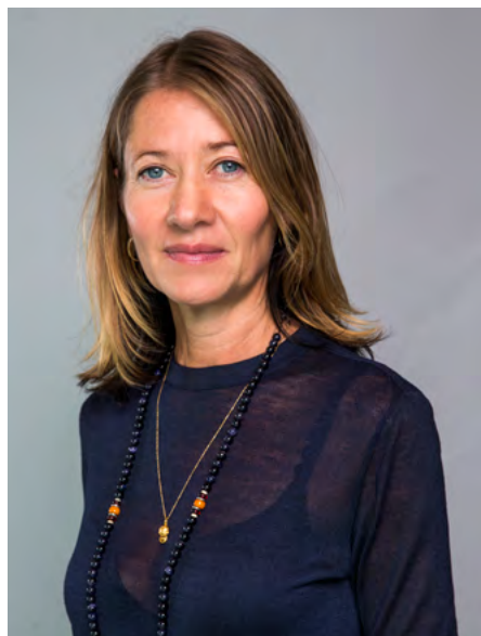
Tjeckiens ambassadör Viktoria Li.

Sveriges nya ambassadör i Tjeckien ser fram emot att diskutera och arbeta med just denna typ av frågor tillsammans med tjeckiska partners och kollegor under året.