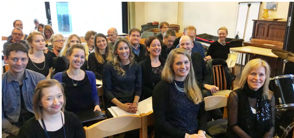
Glada miner på körfesten i Döbling

Sedan år 2004 anordnas denna körfest som riktar sig till evangeliska kyrkor i Wien. Evenemanget, som denna gång samlade sju körer, organiseras av församlingen och körledaren i Weinbergkirche (Döbling). Svenska kyrkans kör deltog i år för andra gången, den första var för 6 år sedan. Kören inledde sin del av konserten med folksmelodin ”Trilo” och hela framträdandet imponerade stort på åhörarna. Förhoppningsvis kan denna dag bli en årlig tradition. Dagen gav mersmak både ur ett musikaliskt och socialt perspektiv!