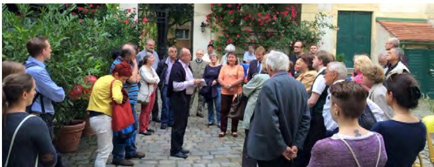
Förra gången Svenska kyrkan var med i Lange Nacht der Kirchen kom många nyfikna besökare

20:45 - 21:00 Vi avslutar kvällen med en gemensam andakt där vårt modersmål också är språket för vår tro.