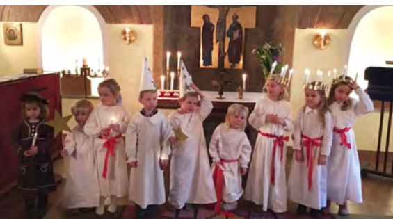
Barnens luciatåg i Wien