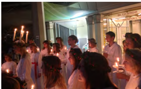
Basaren lockade många besökare, som bland annat kunde njuta av fin sång från Luciakören.