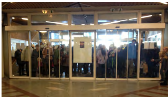
Alla som hjälper till på julbasaren samlas till andakt och säkerhetsgenomgång, innan portarna slås upp