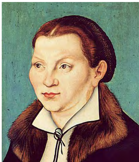
Katharina von Bora

Utan von Bora, hade inte den ”lutherska” kyrkan sett ut på samma sätt, hon är en instrumental del av vår historia som kyrka.