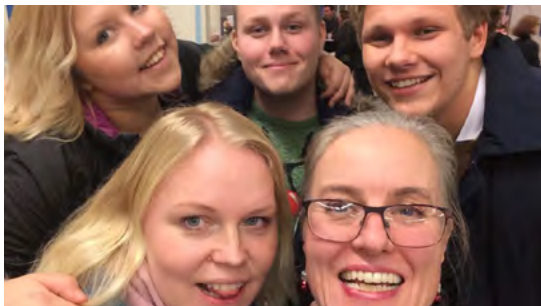
Glada ungdomar från Österhaninge kom till Wien för att hjälpa till.