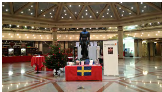
Sedan görs allt i ordning i basarlokalen