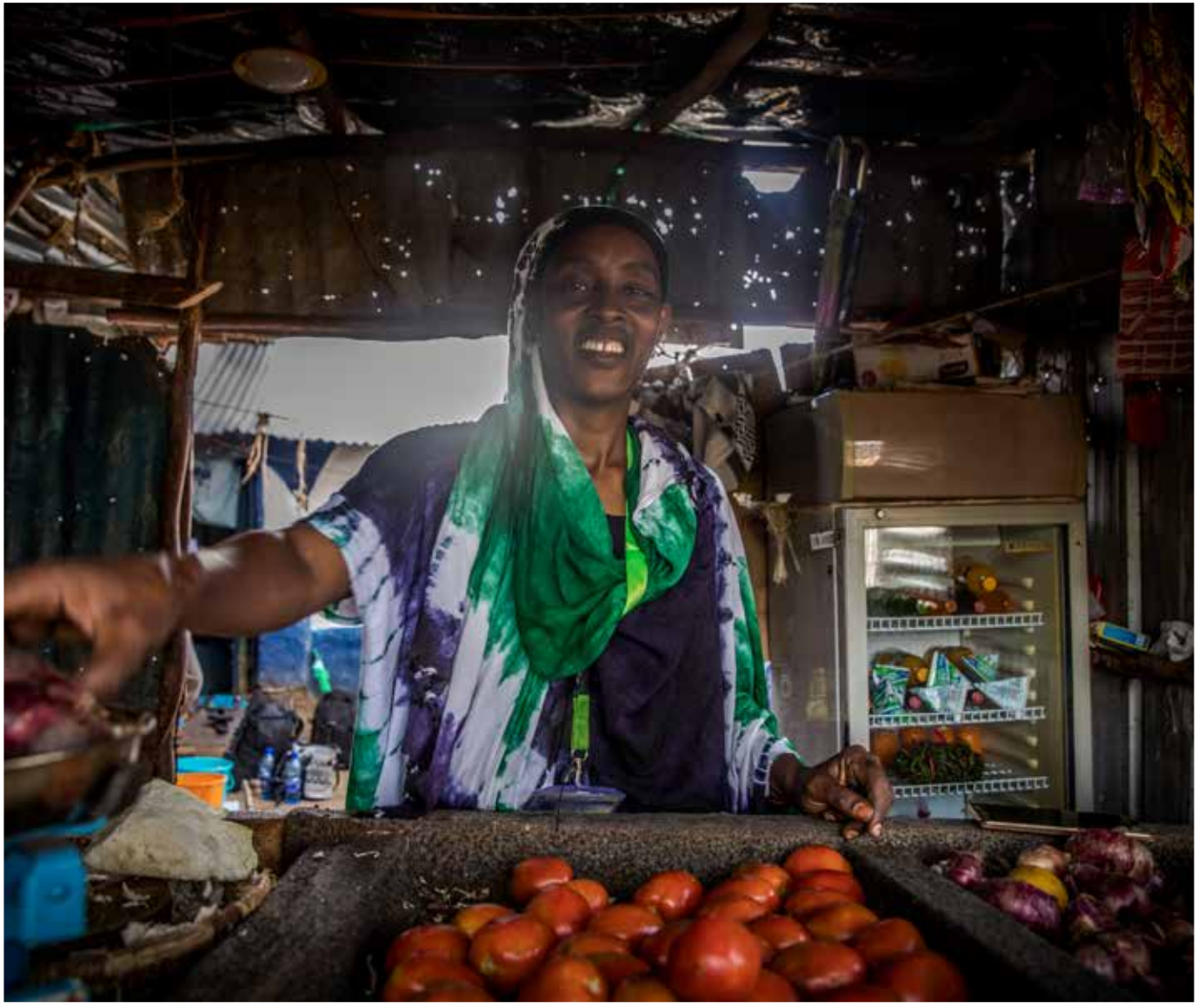
Nadiwa i norra Kenya driver egen fruktaffär.