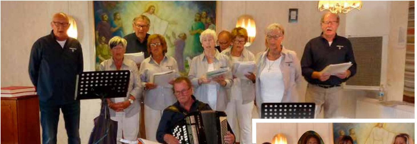
PRO Norge sånggrupp underhöll vid Vägkyrkan 2017-07-28