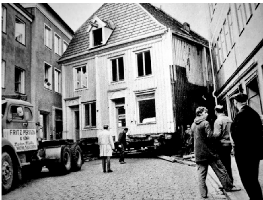
En annan husflyttningsfirma Fritz Persson & söner i Lister Mjällby

Från S:t Olof bar det iväg till Skara där