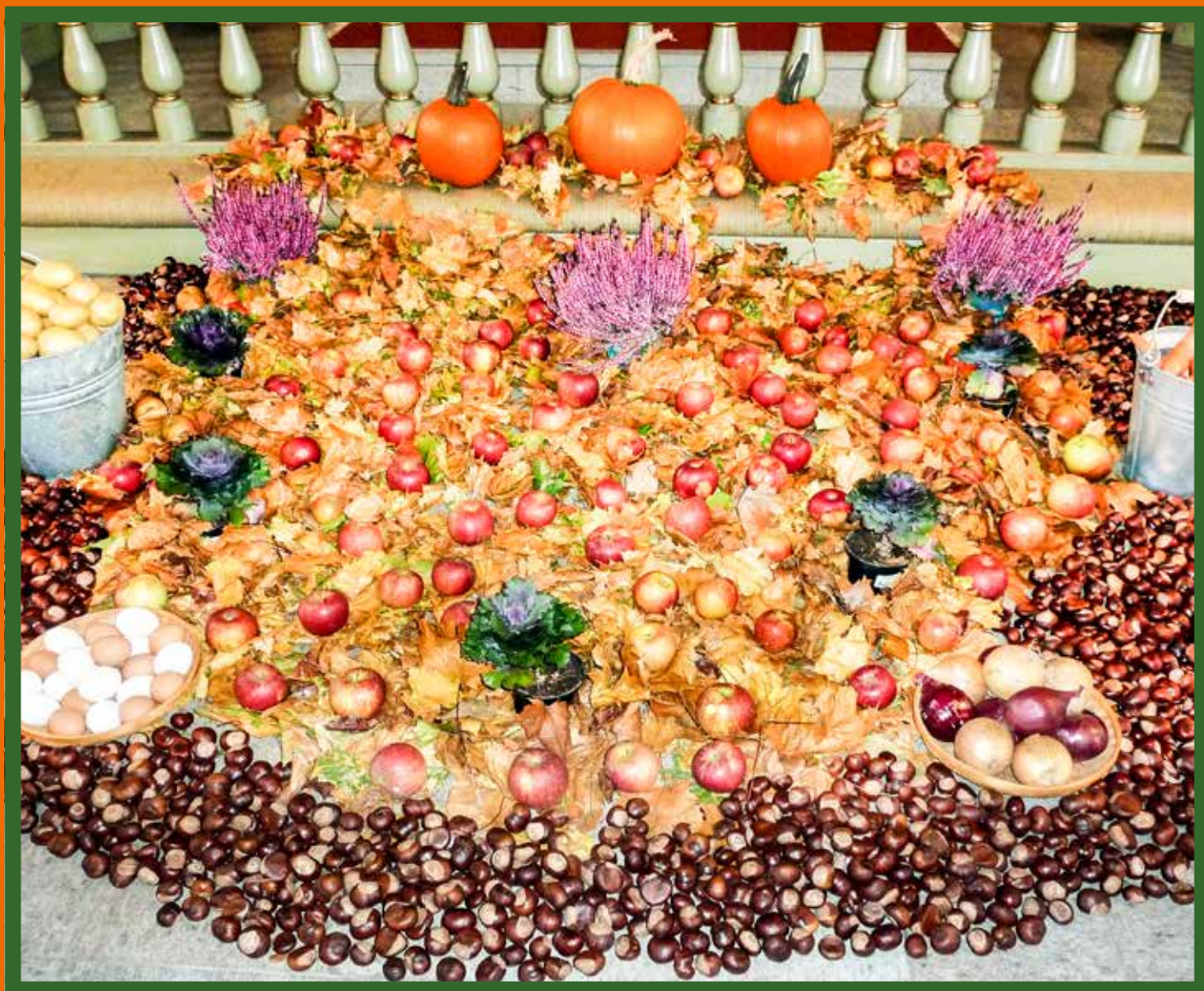
Mjällby kyrka dekorerad inför höstgudstjänsten 2016-10-09!