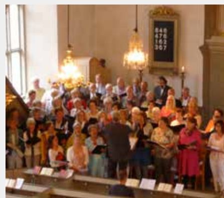
Kyrkokören sjunger tillsammans med körsångare från Sölvesborg ta vid pingstdagens gemensamma musikgudstjänst 2016-05-15.

Kören övar onsdagar kl. 19.00 i Stenlängan i Mjällby. Vår främsta uppgift är att medverka vid framför allt de större högtiderna såsom Allhelgona, 1:a Advent, Jul, Påsk och Pingst. En gammal, härlig tradition för kören är att sjunga in våren på Valborgsmässoafton. Är du intresserad och tycker det skulle vara kul att sjunga med oss så tveka inte att