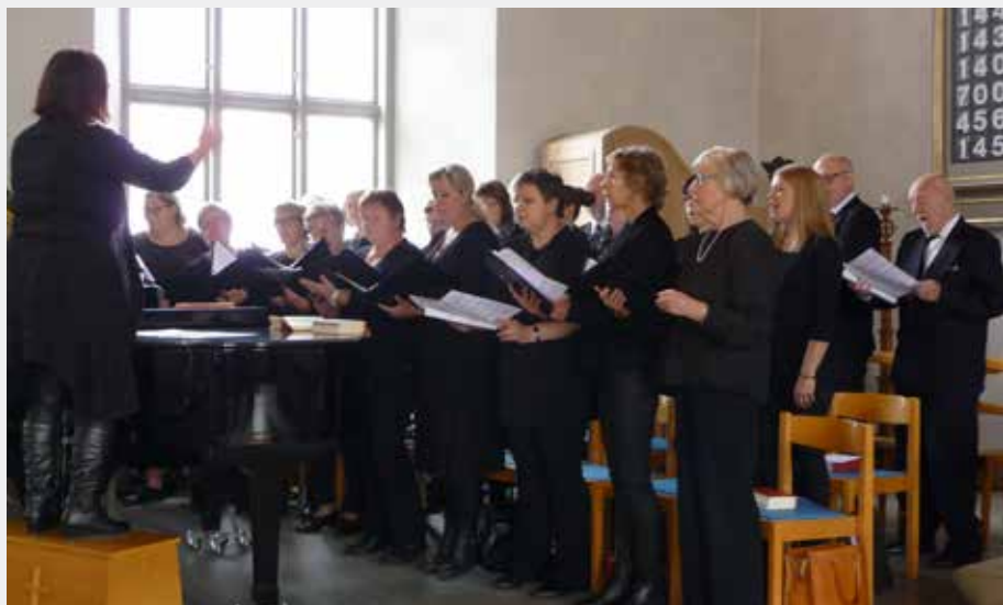
Långfredagsgudstjänst 2016-03-25.