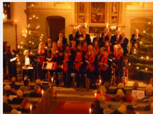
Julkonsert 2015-12-20.