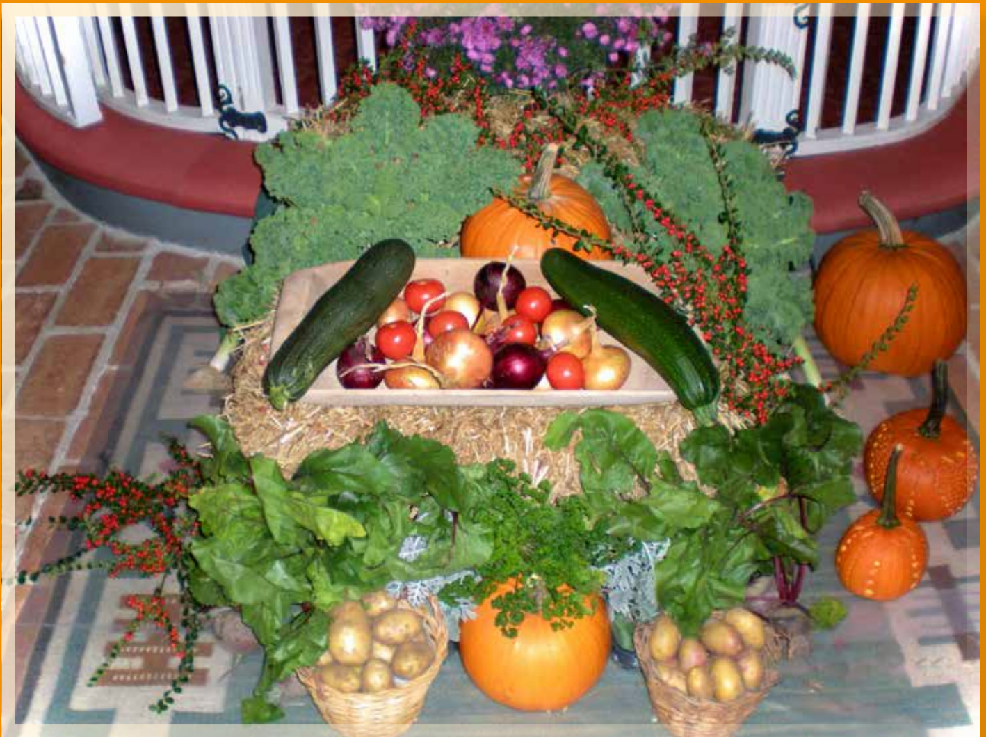
Skörde gudstjänst i Ysane 2015-10-11.