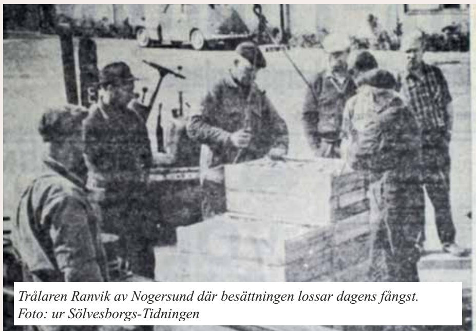
Trälaren Ranvik av Nogersund där besättningen lossar dagens fångst.