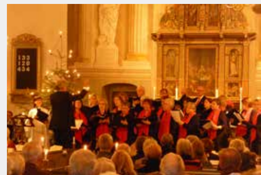
Vi sjunger ut julen trettondedag jul 2015-01-06.