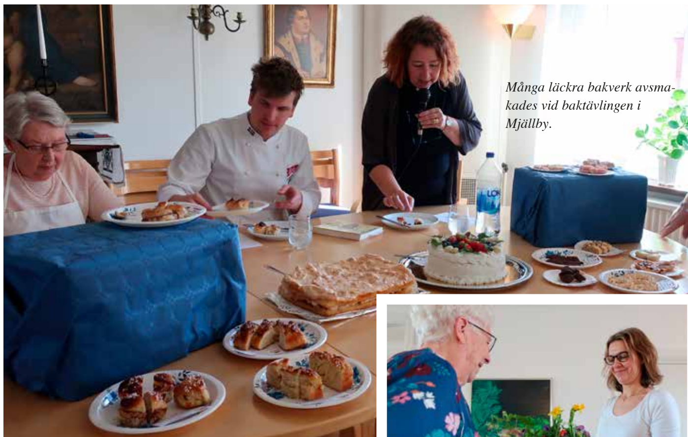
Många läckra bakverk avsmakades vid baktävlingen i Mjällby.