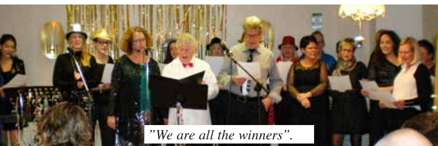
"We are all the winners".