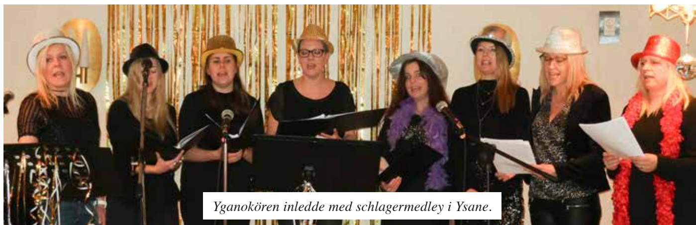
Yganokören inledde med schlagermedley i Ysane.