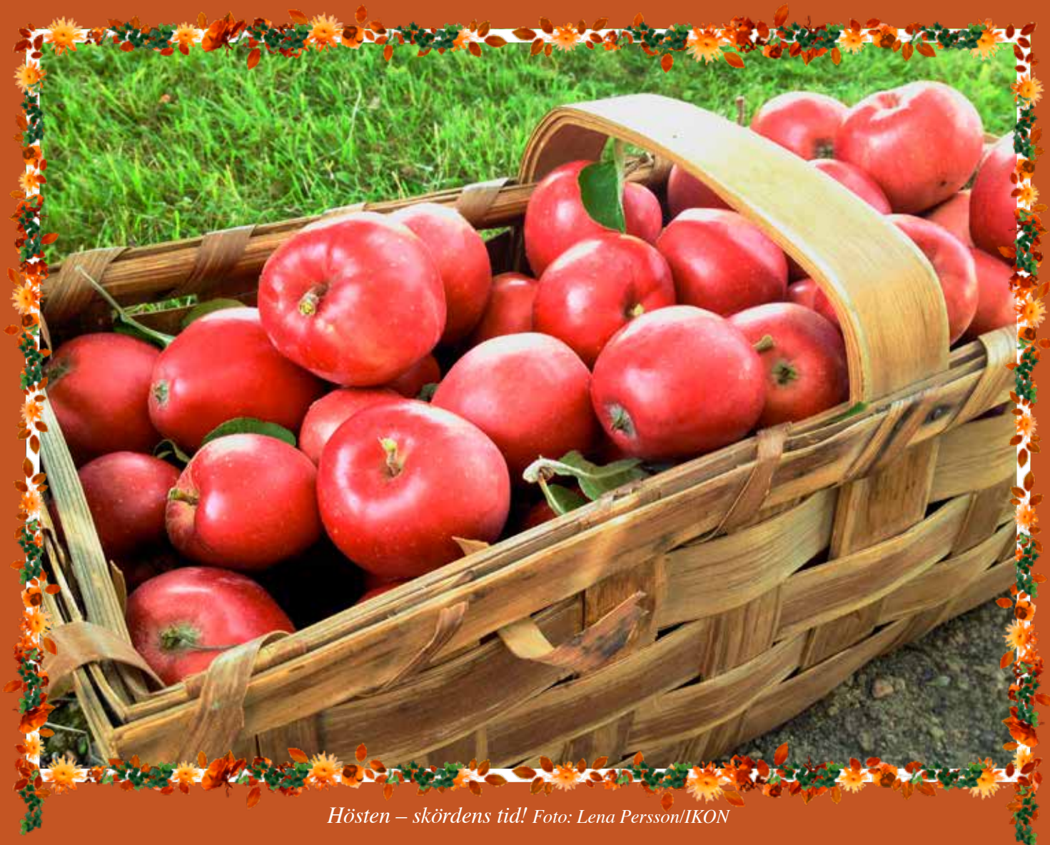
Hösten – skördens tid!