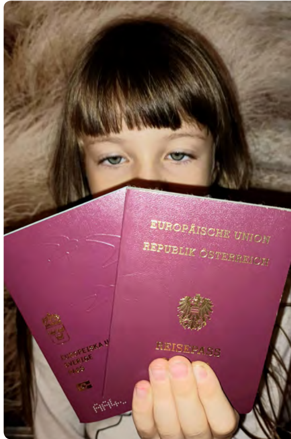
Vilket pass ska man välja? Kan jag ha två?