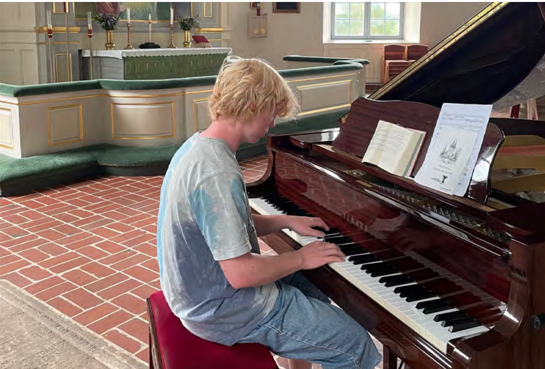
Vid pianot i Rydaholms kyrka

Det var en resa som vi fick i och med att vi är aktiva „Unga ledare“, som ett tack. Det var en otroligt fin resa där man fick många nya perspektiv. Det var en vecka där vi bodde i tält och stängde av mobilen helt, vilket verkligen var avkopplande. Jag rekommenderar starkt Taizé till alla som bara vill koppla av och lära känna flera olika kulturer.