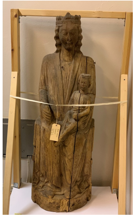
Här har vi Maria-skulpturen med Jesusbarnet. Är i betydligt bättre skick än St Olof.