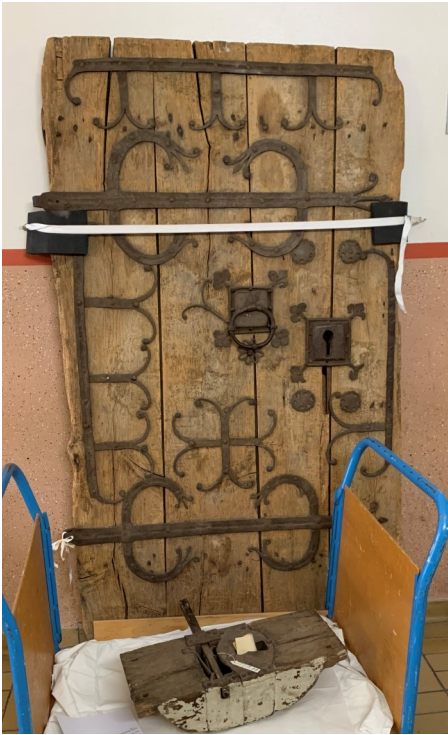
Knista kyrkas medeltida kyrkport och tillhörande lås.