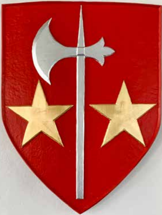
• LISTER'S HÆRADS VAPENSKÜLD • MED ANOR FRÅN DANSK MEDELTIID