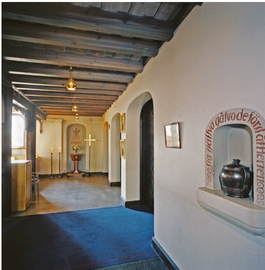
Under orgelläktaren. Nisch med offerbössan och i fonden sekundär dopfunt.

Långhuset täcks av ett treklöverformat tunnvalv av grålaserat trä med målad dekor av konstnären Yngve Lundström (1885–1961), som även stått för all dekormålning i övrigt i kyrkorummets. Mittvalvet har fyra ankarbjälkar och