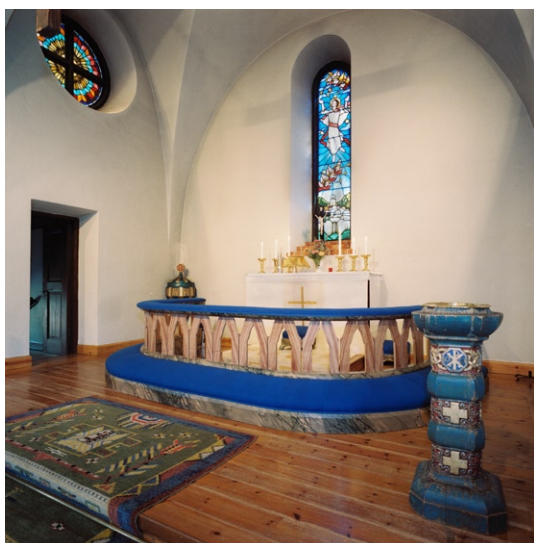
Koret med dopfunt i förgrunden.

för. Taket är kryssvälvat och är liksom väggarna vitputsade, trägolvet är lackat. Det i öster placerade höga rundbågade fönstret med glasmålning fungerar som altarmålning. Den föreställer Kristi himmelfärd och är komponerad av Carl