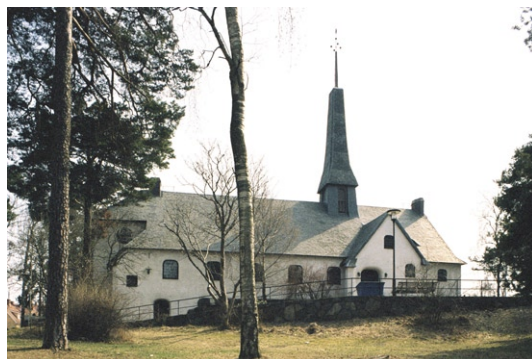
Exteriör från norr.

Enskede kyrka består av ett rektangulärt långhus med ett smalare, rakavslutat kor i öster. I Bergstens ursprungliga ritningar var byggnaden orienterad med koret i väster men vid uppförandet spegelvändes ritningarna med en traditionell kor placering i öster. Genom att terrängen är sluttande är kyrkan högre i öster med sakristian placerad under koret med entré från markplanet. Huvudentrén finns i norr. Den ursprungliga vaktmästarbostaden på vå-