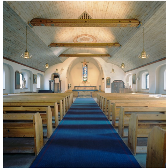
Kyrkorummets mot koret .

pryds av två stora målade medaljonger med en ängel inom en krans av moln. Väggarna är putsade i vitt och golvet belagt med grå linoleum. De ganska låga, korgbågiga fönstren är placerade i djupa nischer och blyspröjsade med klart antikglas.