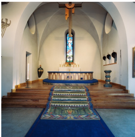
Koret med dopfunt t h och piscina t v.

för. Taket är kryssvälvat och är liksom väggarna vitputsade, trägolvet är lackat. Det i öster placerade höga rundbågade fönstret med glasmålning fungerar som altarmålning. Den föreställer Kristi himmelfärd och är komponerad av Carl