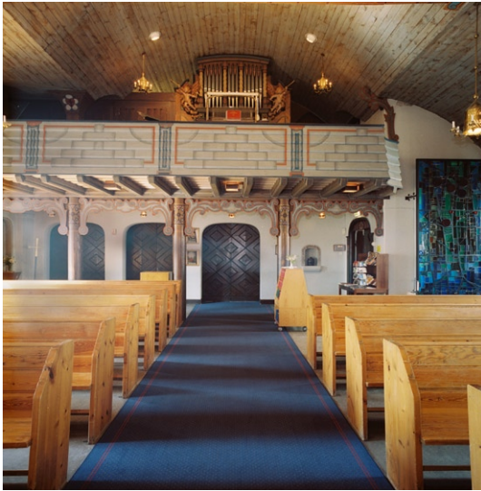
Kyrkorummet mot väster och orgelläktaren. Bakom dörrarna ligger samlingsalen.