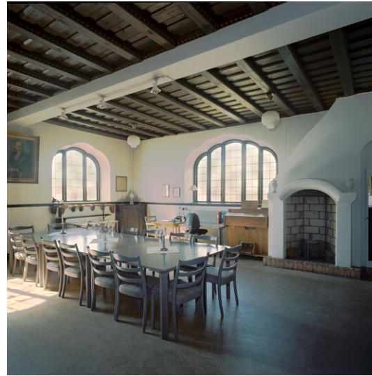
Samlingsalen med öppen spis.

Den sk kyrksalen eller samlingsalen längs västerut i kyrkobyggnaden kan vid behov förenas med långhuset genom tre breda dubbeldörrar som då slås upp. Det helt kvadratiska rummet har mörklaserat tak med synliga bemålade takbjälkar och linoleumgolv. Väggarna är nedtill boaserade och där ovan vitputsade, i väster med en stor vitkalkad öppen spis. Istället för rummets ursprungliga kyrkbänkar finns här numera ett modernt sammanträdesmöblemang och skåp för förvaring av antependier. Den fd vaktmästarbostaden om två rum och kök, som ligger bakom orgelläktaren, nyttjas numera som församlingslokaler, t ex för enskilda samtal, körövningar, textilförvaring osv.