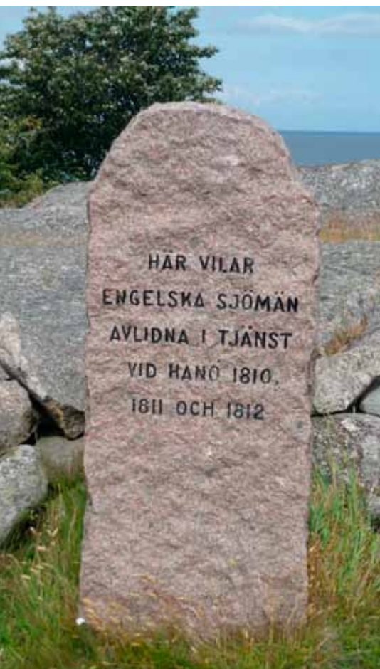
Äreminne på Engelska kyrkogården, Hanö. Foto: M.B., 2009.