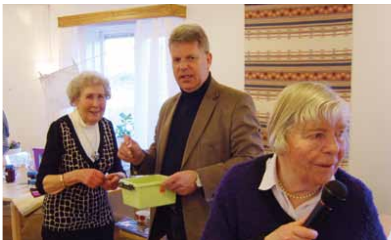
Kyrkliga arbetskretsens vårförsäljning.