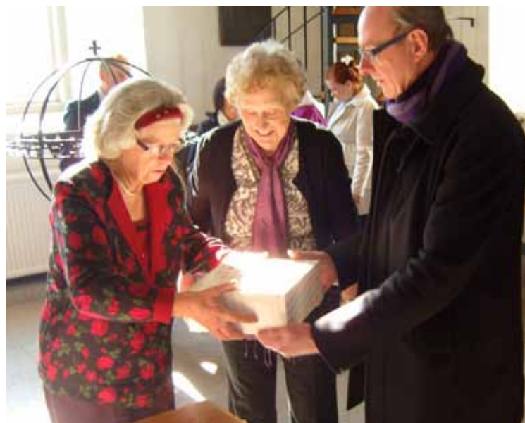
Försäljning av semlor till förmån för fasteinsamlingen.