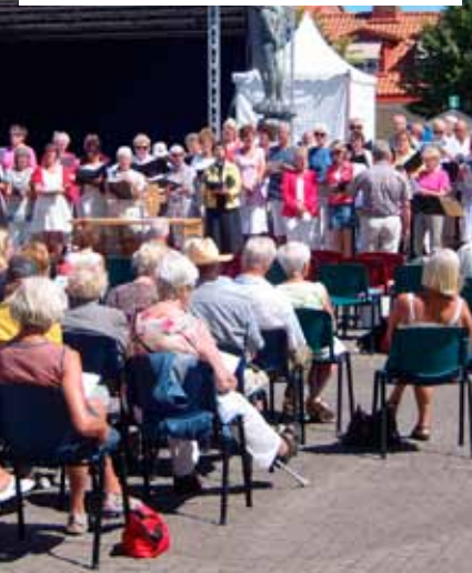
Killebomgudstjänst på Stortorget i Sölvesborg.