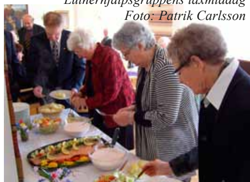
Lutherhjälsgruppens laxmiddag