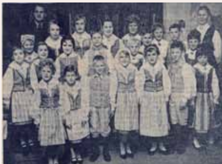
Folkdansuppvisning i Lörby skola. Fotot publicerat i Kristianstadsbladet 20/11 1962

– De sjukas vänner i Mjällby ger 2.050 kronor i julgåvor, att utgå i