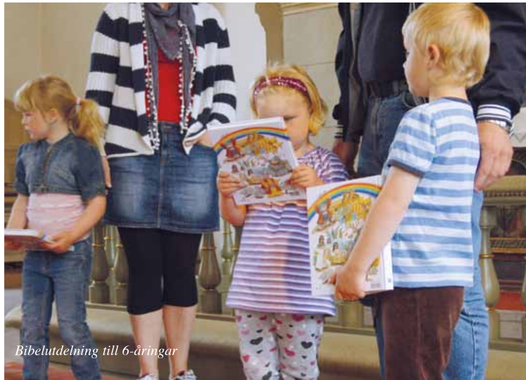
Bibelutdelning till 6-åringar