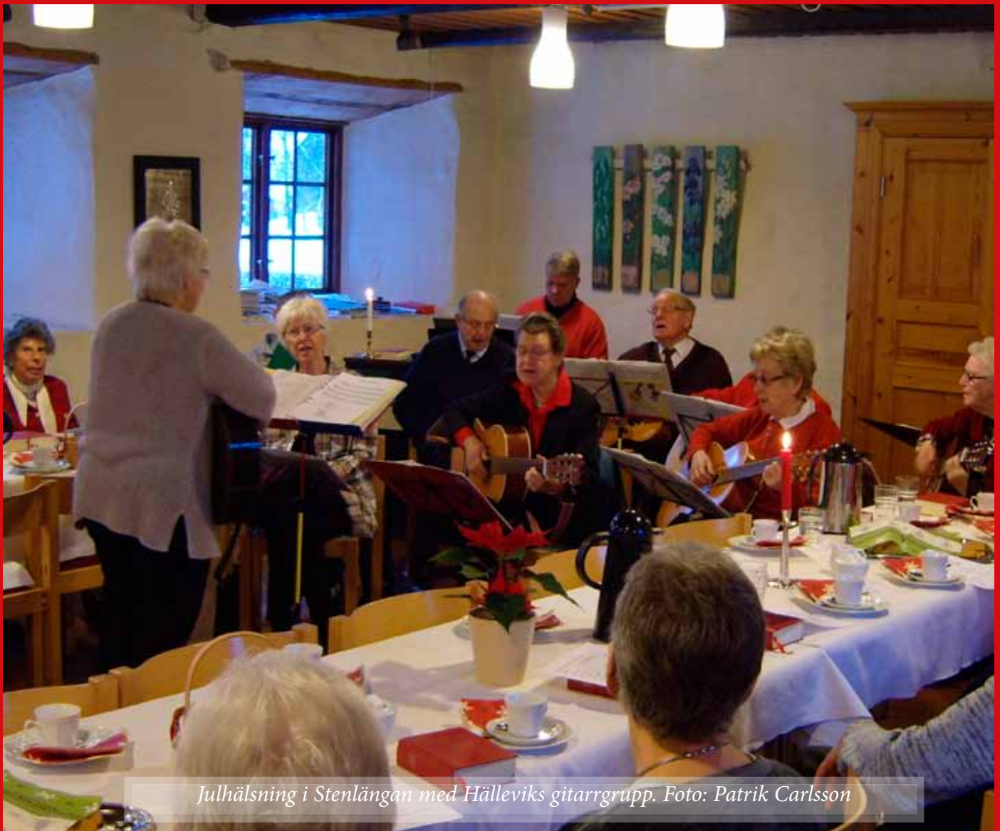
Julhälsning i Stenlängan med Hälleviks gitarrgrupp.