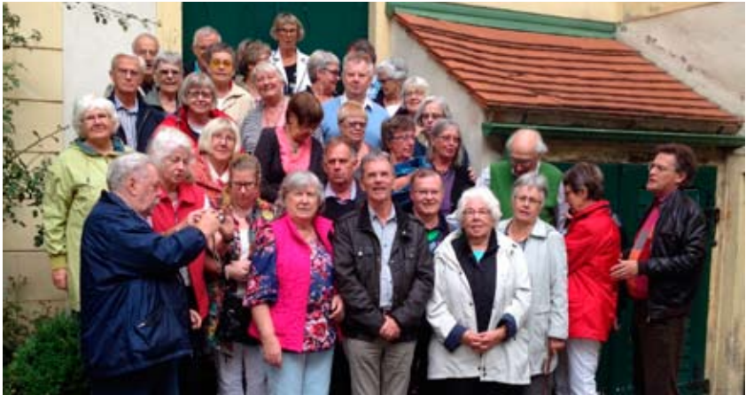
Besök från Trollhättans församling

Några av besöken har annonserats i förväg. På frågan om vi behövt något speciellt från Sverige har svaret alltid varit densamma: Saffran! En önskan som har uppfyllts med råge. Så när till exempel Trollhättans församling var här utökades kyrkans saffrans-förråd betydligt. Ett välkommet tillskott inför julens Lussekattsbakning! Tack! Andra besök har varit mer spontana, men minst lika välkomna! Kaffet räcker och bullar finns.