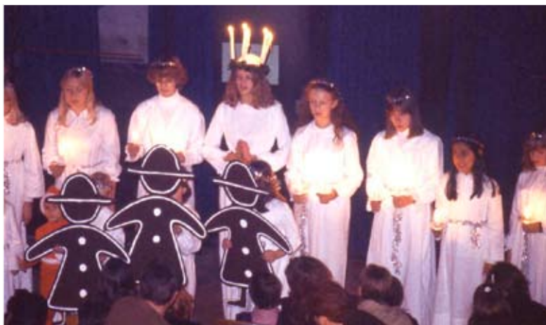
Luciatåg på julbasaren 1980

Under hösten 1978 arbetade kommittén med förberedelserna inför basaren och den 9 december 1978 ägde vår första basar rum i Albert Schweitzer-Haus och denna blev redan första året en stor succé. Behållningen inkl. kollekten vid julgudstjänsten uppgick till 57 600 Schilling. Därmed var huvudsyftet med julbasaren uppfyllt, nämligen att ge kyrkorådet möjlighet att finansiera fyra gudstjänster per år.