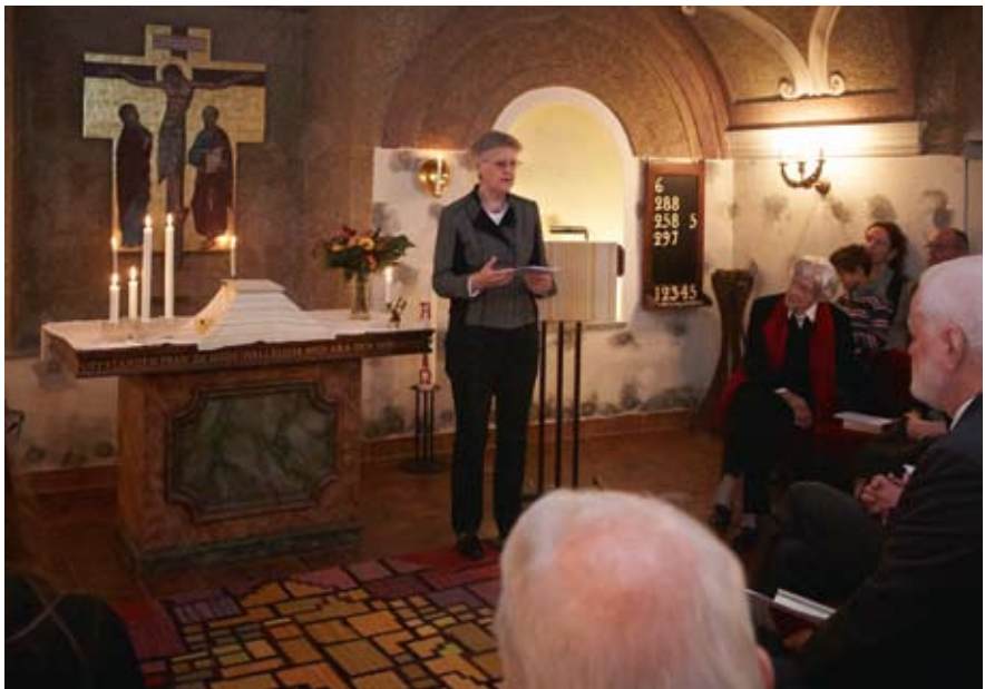
Föredrag vid 40-årsjubileum i Sala terrena den 6 oktober 2013