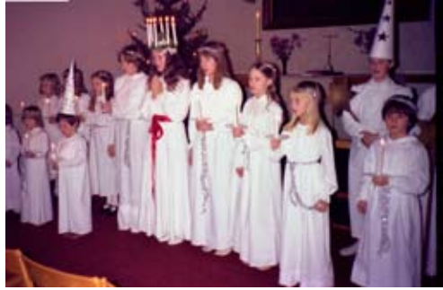
Luciatåg Seegasse 1981

Den svenska traditionen har sitt ursprung i både förkristna och kristna seder och har genomgått en utveckling genom århundradena. Det finns flera teorier varifrån firandet kommer. En teori är att firandet har en koppling till det sicilianska skyddshelgonet Sankta Lucia (ca. 238-308 e. Kr.) som dog en martyrdöd under kejsar Diocletianus förföljelse. Hon helgonförklarades efter sin död och har fått den 13 december som sin festdag inom den katolska kyrkan. Troligtvis har helgonet Lucia enbart namnet gemensamt med högtiden, ordet/namnet Lucia kommer från latinets Lux (genitiv: lucis) som betyder ljus.