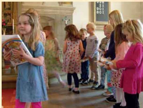
Bibelutdelning till sexåringar 31 maj.