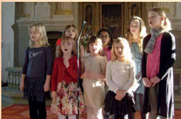
Barnkören sjunger på Kyndelsmässodagen 8 februari.