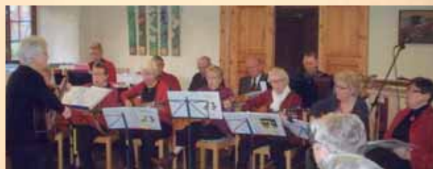
Julhälsning i Stenlängan med Hälleviks gitarrgrupp 21 december.