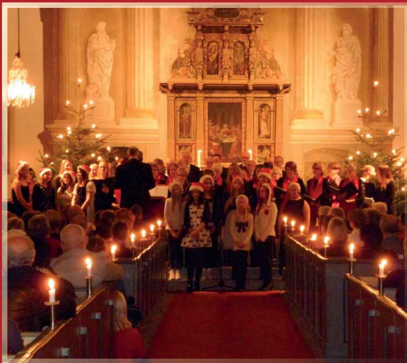
Julens glada budskap!.