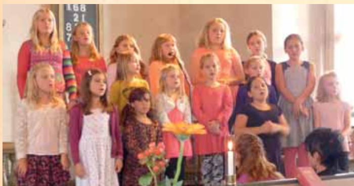
Barnkören medverkar vid skördegudstjänsten i Mjällby kyrka den 11 oktober.