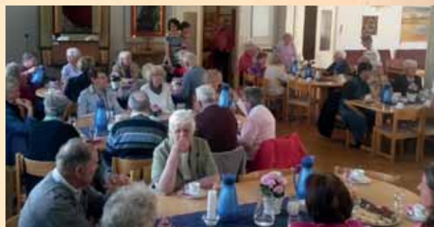
Torsdagsträffens utfärd 21 maj. Kaffe i Mörrums församlingshem.