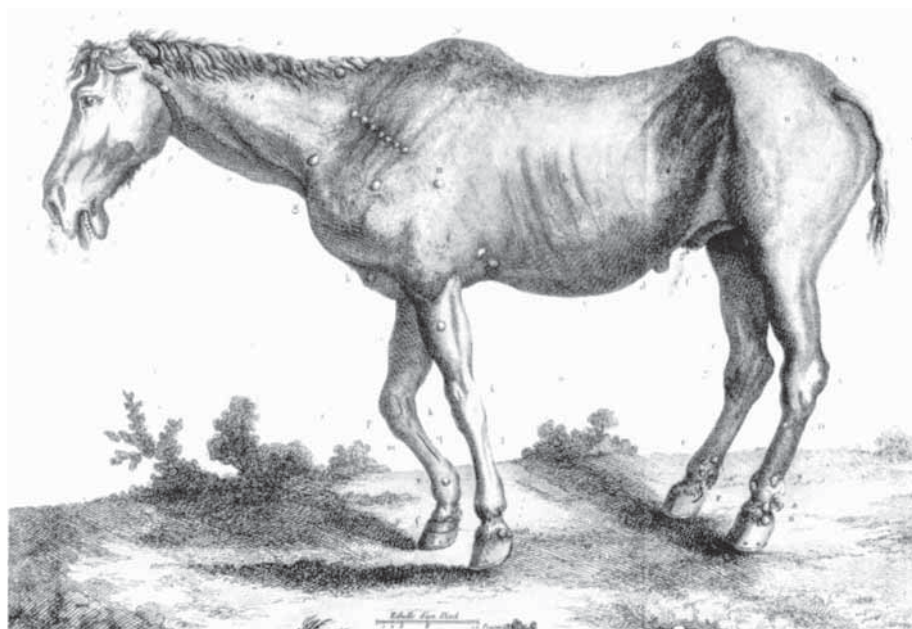
"Sjuk häst", bild ur boken "Peter Hernquists sjukdomslära – husdjurens inre sjukdomar"