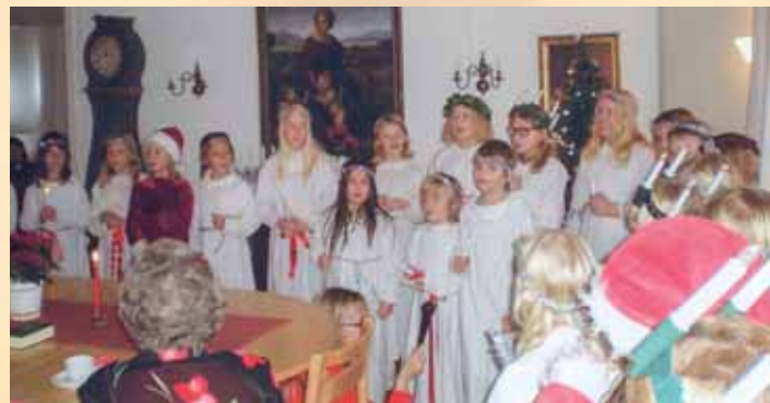
Barnkörens luciatåg på Torsdagsträffens julfest den 12 december.