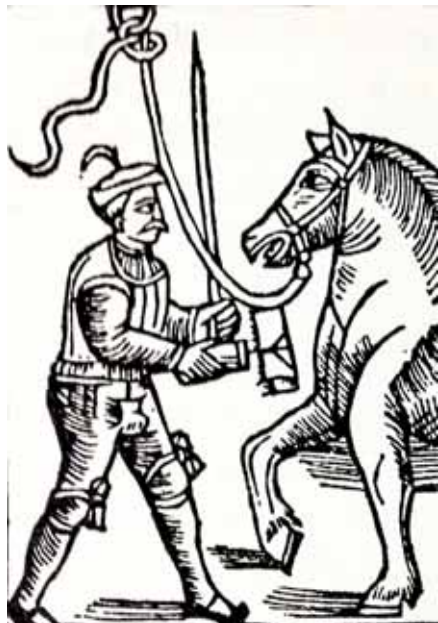
En bonde ryktar sin häst, detalj ur Olaus Magnus "Historia om de nordiska folken" 1555

ännu värre plågoris för allmogen. Särskilt svårt härjade dessa boskapspester under 1700-talet. Från Centralasien spred sig den farliga och smittosamma sjukdomen vid århundradets början till Västeuropa. Knappast något land skonades.