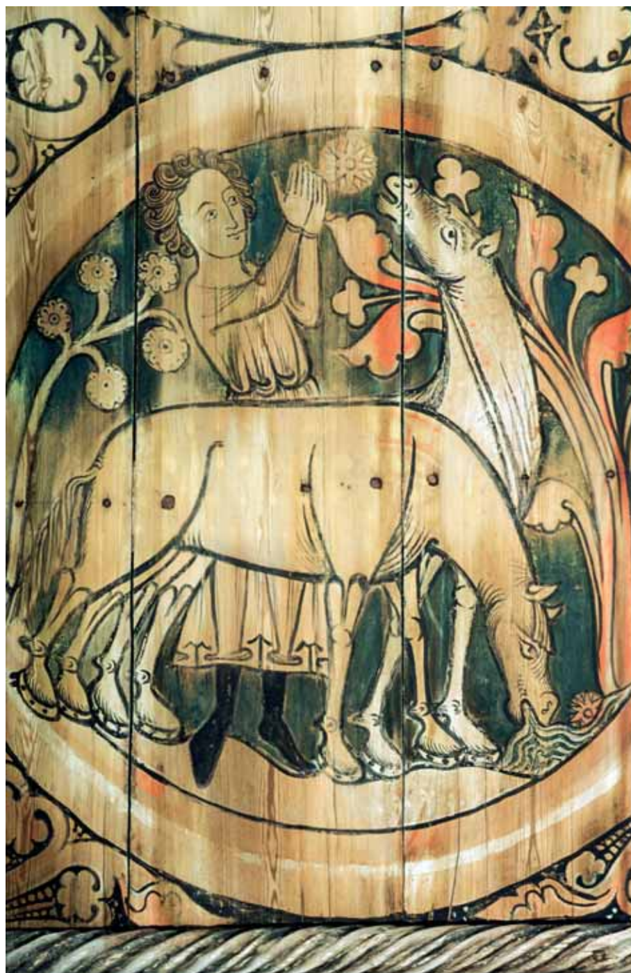
Staffan stalleträng vattnar sina fålar. Medeltida takmålning i Dädesjö kyrka i Småland. Annandag jul brukade drängar på Lister in på 1800-talet i fotsida vita skjortor till häst rida ”Staffan Skee” i bygden och sjunga Staffansvisan, gärna med någon särskilt värmande dryck till tack.

Även om svältfödningen i sig utgjorde ett ständigt bekymmer inom boskapsskötseln, kom de upprepade stora kreatursfarsoterna att bli ett