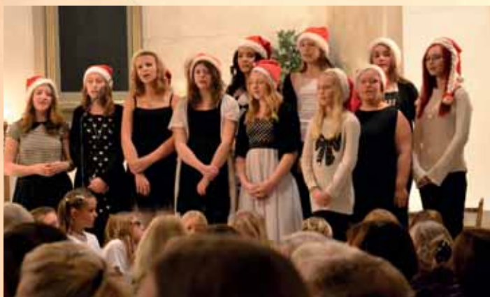
Barn- och ungdomskörerna medverkar vid julkonserten 21 december i Mjällby.