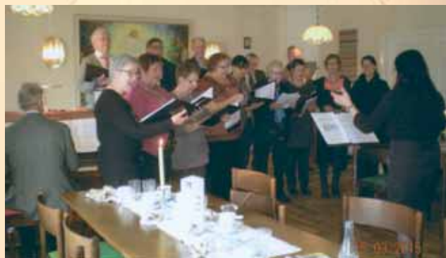
Mjällby kyrkokör medverkar vid Midfastosöndagens kyrklunch i Ysane 15 mars.