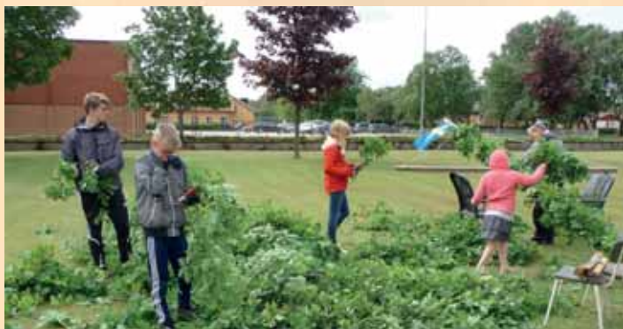
Midsommarstången kläs i Mjällby den 18 juni.