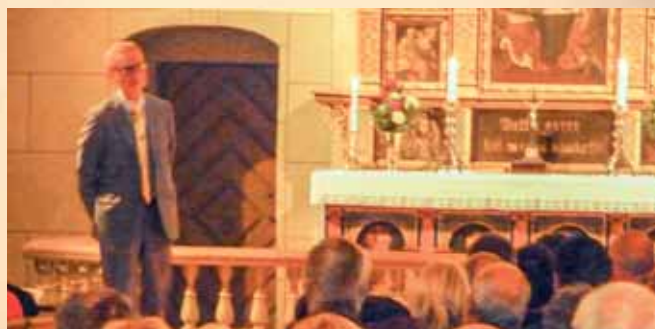
Bygdehistorisk afton och professor Dick Harrison föreläser den 14 oktober om "Korståg i Norden".