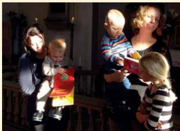
Förra årets dopbarn får en gåva på Kyndelsmässodagen 8 februari.