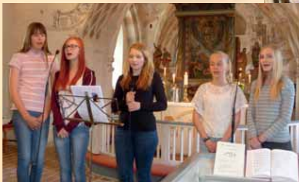
Mässa i Ysane kyrka med skönsång av Ungdomskören.