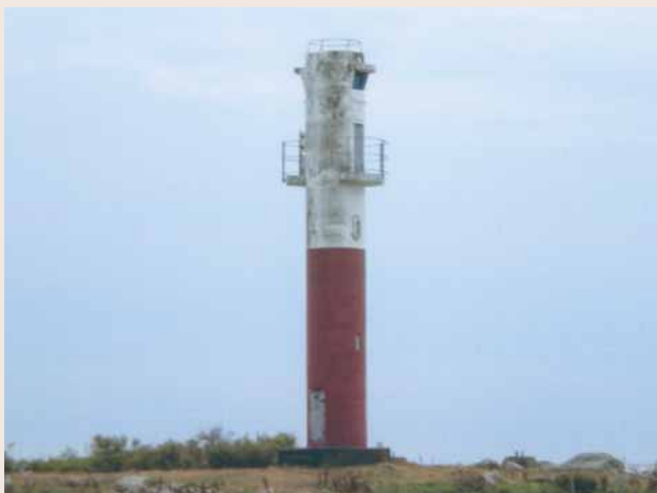
Ett nytaget foto av fyren på Sillnäs udde.

- Kokhöns 4.95 kr/kg, fläskkotlett 11.20 kr/kg, tomat 2,60 kr/kg, bananer 1.90 kr/kg. I baren: bruna bönor med fläsk och brylépudding kr. 3.50, isterband med stuvad potatis och glass kr. 3.50