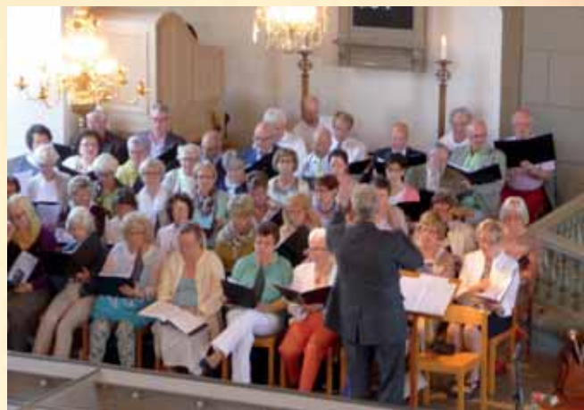
Skärgårdssextetten med körsångare från Mjällby och Sölvesborg medverkar vid pingstagens musikgudstjänst i Mjällby.