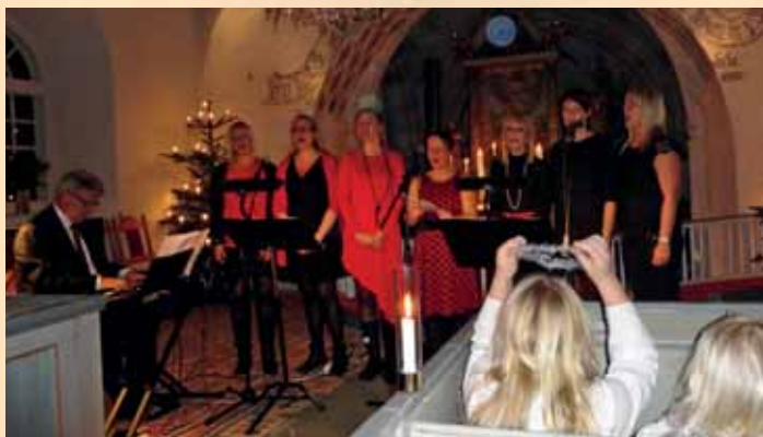
Adventskonsert i Ysane med barnkörens luciatåg och Yganokören 14 december.