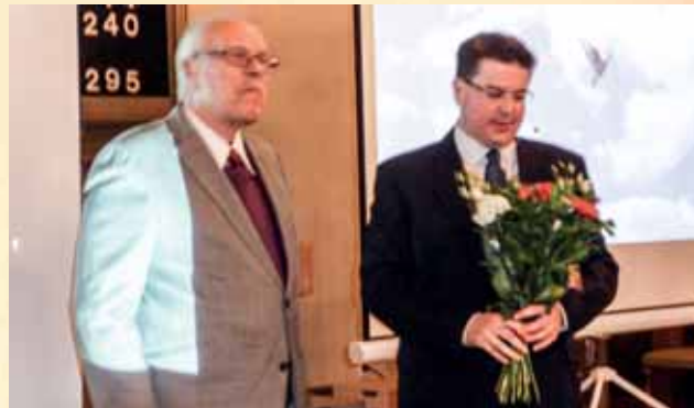
Bygdehistorisk visning om S:t Petrustavlan i Mjällby kyrka.