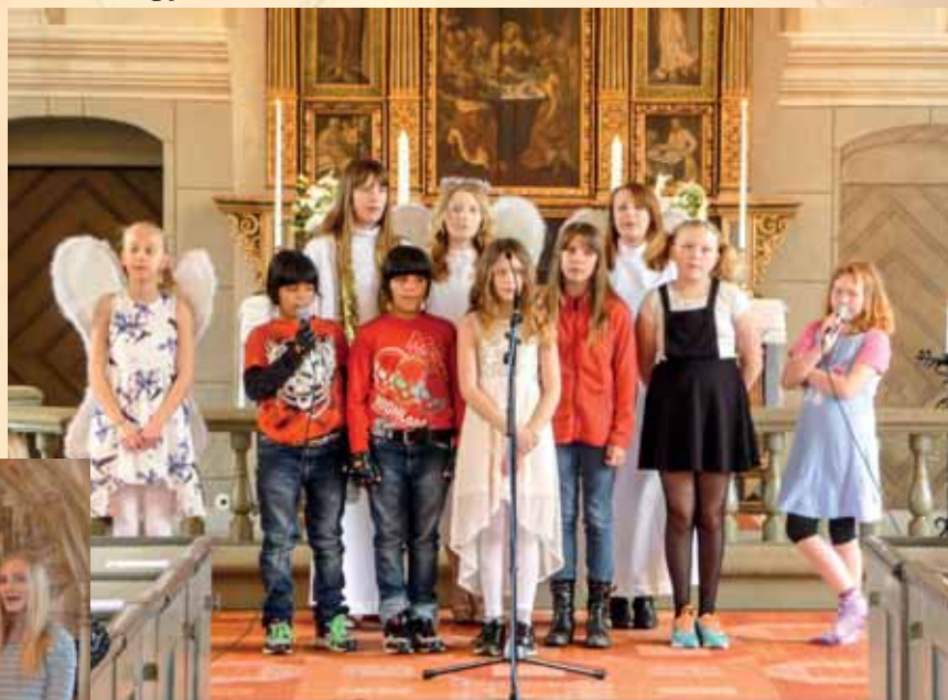
Barnköreerna uppför sin musikal vid bönsöndagens gudstjänst i Mjällby kyrka.