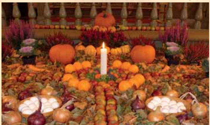
Inför skördegudstjänsten den 11 oktober är Mjällby kyrka vackert utsmyckad.