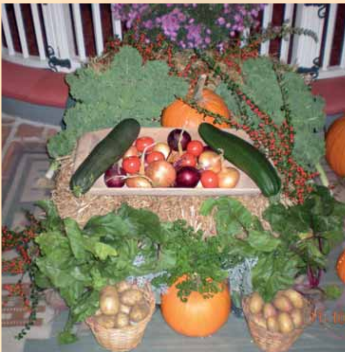
Även Ysane kyrka är rikt utsmyckad inför årets skörde gudstjänst, den 11 oktober.