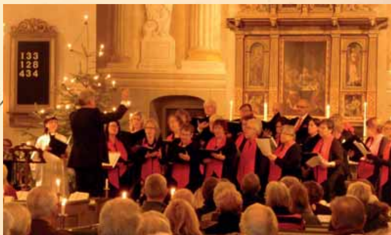
Kyrkokören medverkar vid musikgudstjänsten i Mjällby kyrka trettendedag jul.