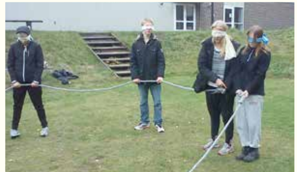
Samarbetsövning för konfirmanderna på Furubodaläqret - svårt!!!