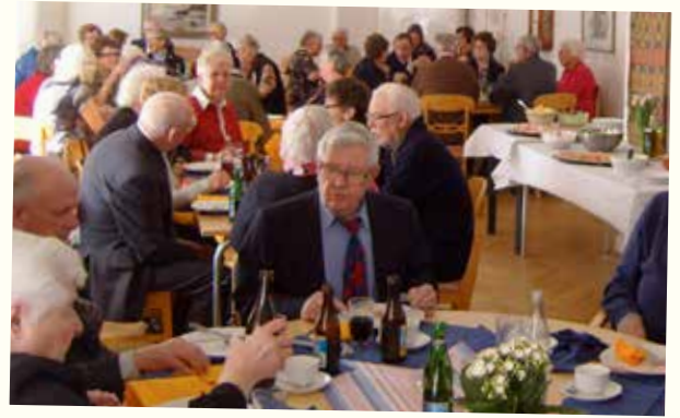
Lutherhjälsgruppens laxmiddag 17 mars