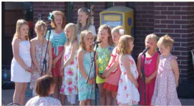
Barnkören sjunger på Stortorget i Sölvesborg 6 juni