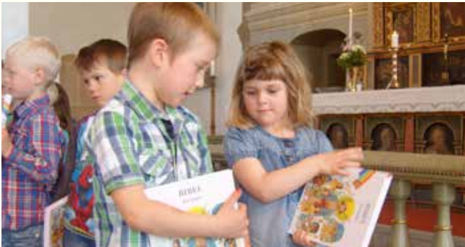
Bibelutdelning till 6-åringar 28 april.