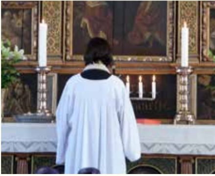
Föböen för HKH Prinsessan Lilian, Hertiginna av Halland samt körmusik med "Mariasånger" på Jungfru Marie bebådelsedag.