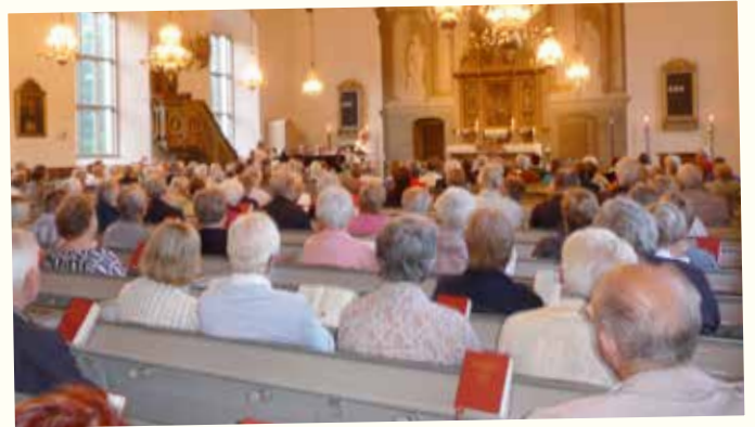
Musik och lyrik i sommarkvällen midsommardagen 22 juni.