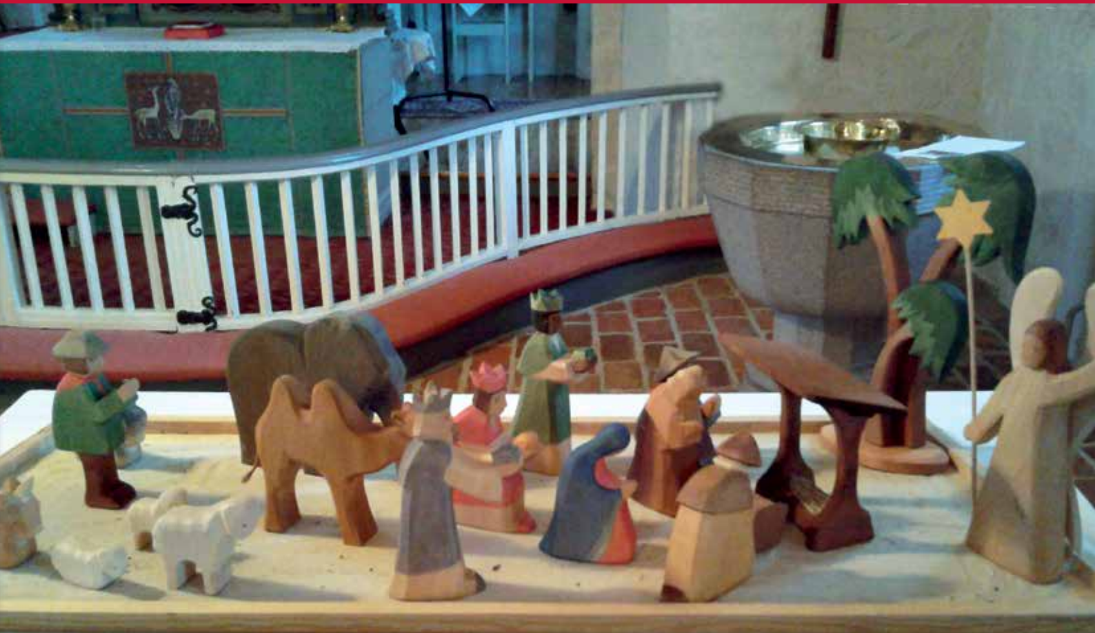
Julkrubban i Ysane kyrka.