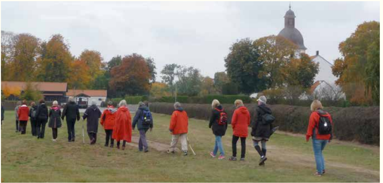
Pilgrimsvandrare nalkar, under klockringning, Mjällby kyrka.