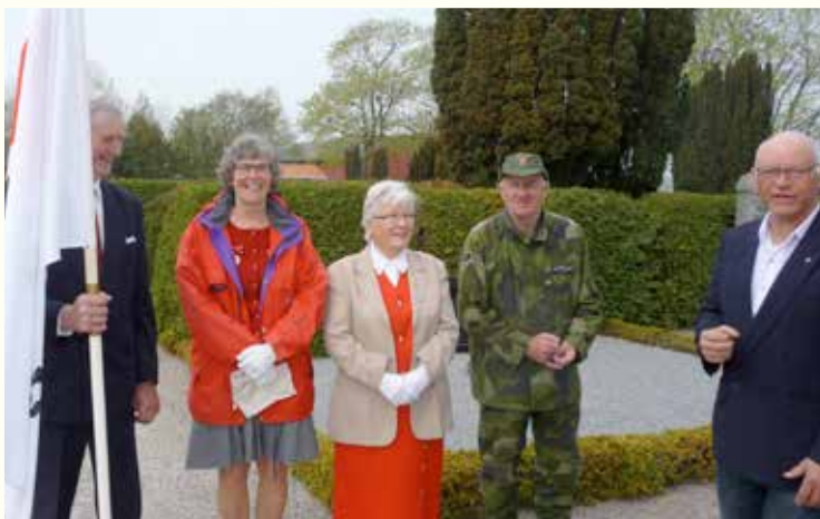
Röda Korset och Hemvärnet medverkade vid gudstjänsten på Kristi himmelfärdsdag. Foto: M.B. 2013