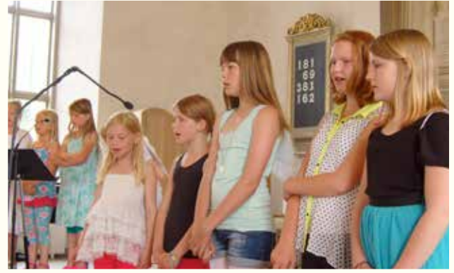
Gudstjänst med musikal 1 juni.