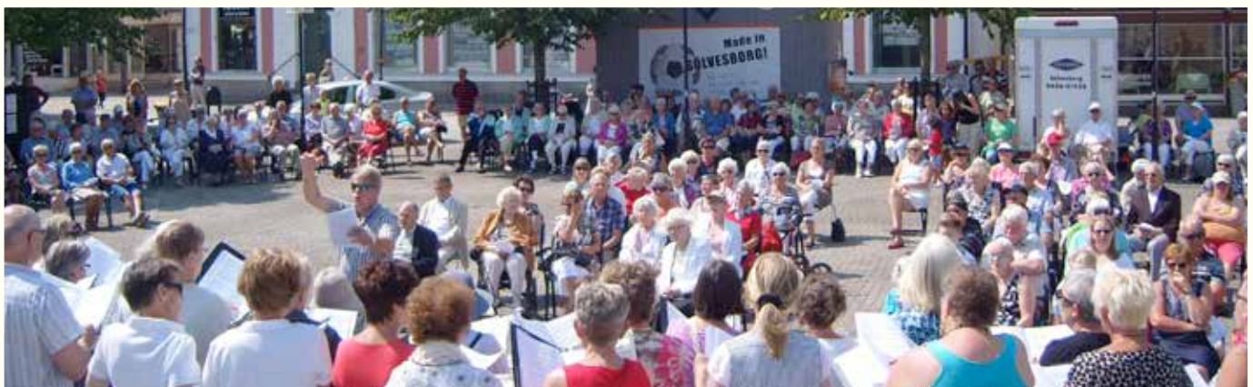
Killebomgudstjänst 7 juli.