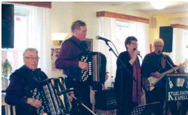
Karlssons Kapell underhåller på Torsdagsträffen.