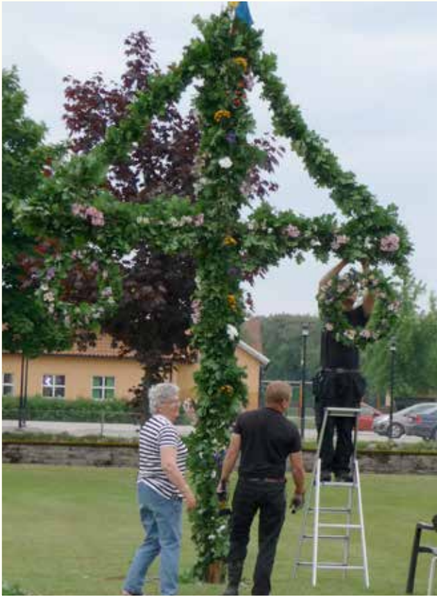
Midsommarstången kläs inför dansen.