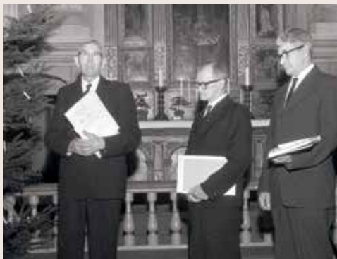
Ledamöter från kyrkorådet avtackas.

Skicka in din lösning senast den 13 januari till "KyrkNytt, Mjällby församling, Kyrkvägen 4, 294 71 SÖLVESBORG" eller lämna den på pastorsexp. Märk kuvertet "Vinterkryss 2013/14" 1:a pris, Rättvisemärkta produkter värde 250 kr 2:a pris, Rättvisemärkta produkter värde 150 kr 3:e pris, Rättvisemärkta produkter värde 75 kr OBS! Glöm inte att fylla i namn och adress