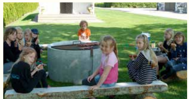
Miniorernas våravslutning 22 maj.