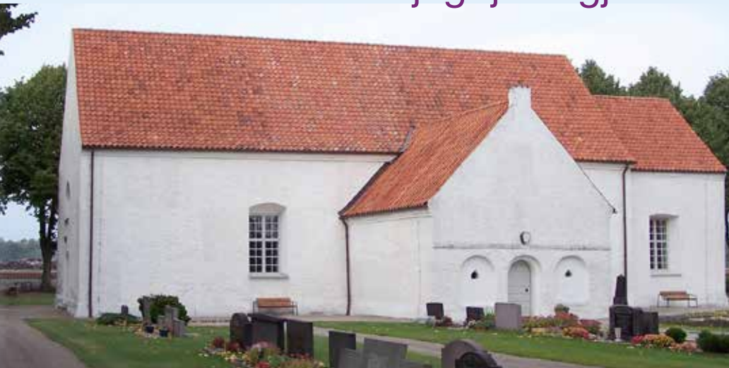
Gualövs kyrka

Under 1960-talets aftonväkt hade jag under ett par år venia concionandi, utfärdad av den dåtida Lundabiskopen Martin Lindström.