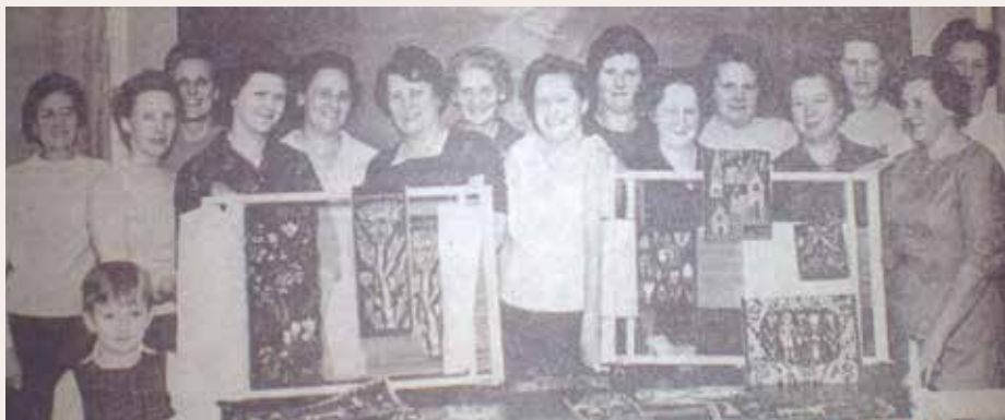
Flamskvävnadskurs i Mjällby avslutad.