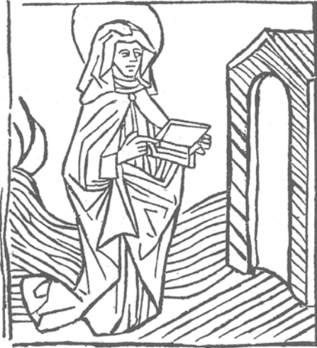
S:ta Gertrud av Nivelles. Träsnitt från 1400-talet.

nämligen att ”Gud är en, och en är förmedlaren mellan Gud och människor, människan Kristus Jesus”, varigenom man avvisar behovet av andra kanaler till Gud än Jesus själv. Däremot ser man ofta helgonen som goda föredömen och efterföljansvärda exempel.