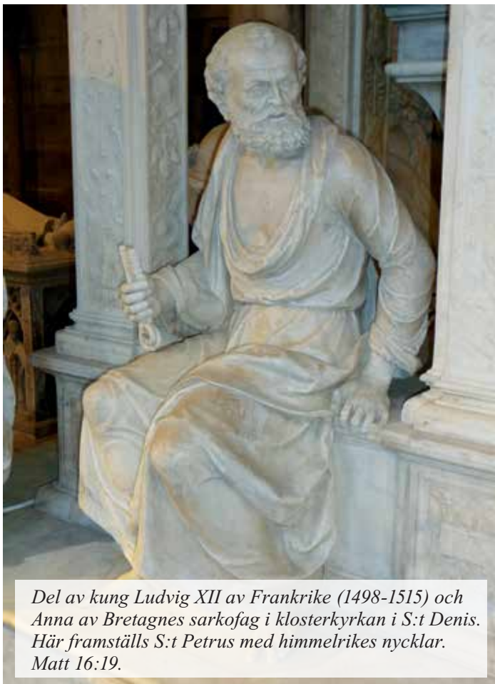
Del av kung Ludvig XII av Frankrike (1498-1515) och Anna av Bretagnes sarkofag i klosterkyrkan i S:t Denis. Här framställs S:t Petrus med himmelrikes nycklar. Matt 16:19.