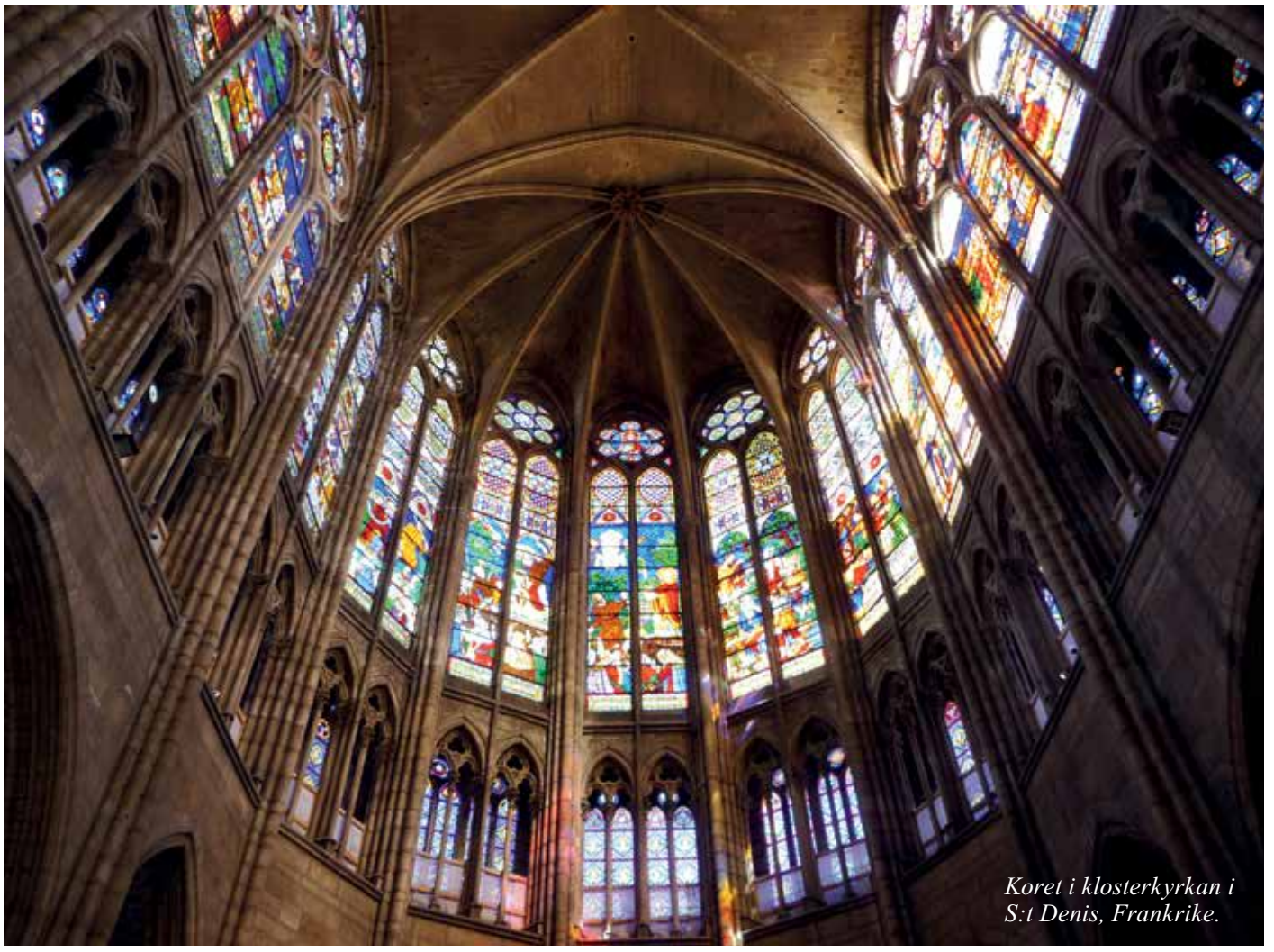
Koret i klosterkyrkan i S:t Denis, Frankrike.