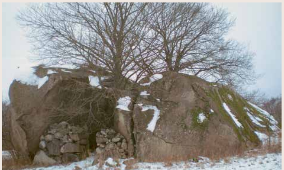
Bäckahallarna som de ser ut idag.