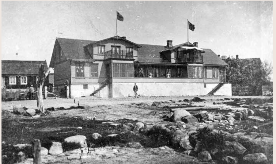
Affären i Hällevik, fotot är taget före år 1905.

- Till elev vid ekonomiska fakulteten vid Lunds universitet har antagits