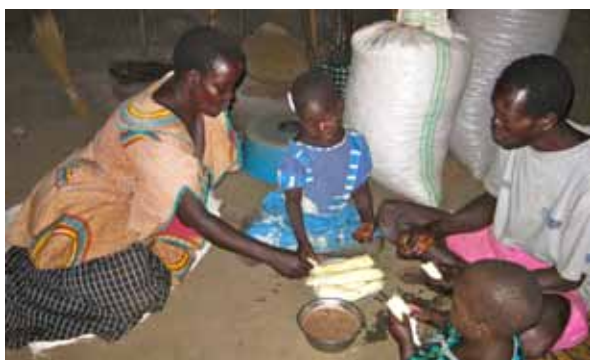
Dags för lunchen som består av kassava och jordnötssås.

Hälsningar i ljusnande fastetid, Solveig Wollin